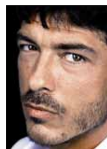
Alessandro Gassman, due volte protagonista allo Storchi. Sopra: una scena di Maria Stuarda , in programma al Comunale. Sotto: un'immagine di Cats , il musical in cartellone nella stagione lirica