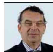
Nicola Rossi - Lega nord