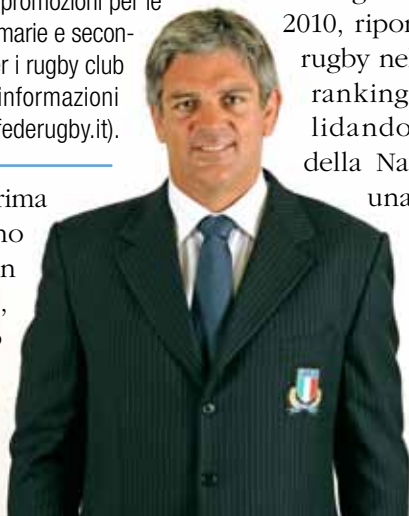
Nick Mallett, allenatore sudafricano della nazionale Azzurra

Biglietti per la partita della Nazionale italiana di rugby contro le Isole Fiji, in programma al Braglia il 27 novembre, sono disponibili sul sito ufficiale della Federazione nell'area biglietteria ( http://ticket.federugby.it ), in tutti i punti vendita Lottomatica Italia Servizi (un elenco è su www.listicket.it ). I prezzi variano da 10 a 80 euro. Sono previsti prezzi speciali e promozioni per le scuole primarie e secondarie e per i rugby club (tutte le informazioni su ticket.federugby.it ).