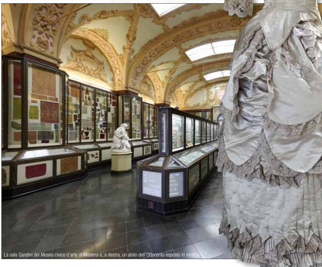
La sala Gandini del Museo civico d'arte di Modena e, a destra, un abito dell'Ottocento esposto in mostra

Esperti internazionali parteciperanno il 26 e 27 novembre a due giornate di studio organizzate dal Museo civico d'arte, un'occasione per far conoscere i 3 mila frammenti della collezione di tessuti "Gandini". In mostra anche velluti, abiti dell'Ottocento e ricami contemporanei