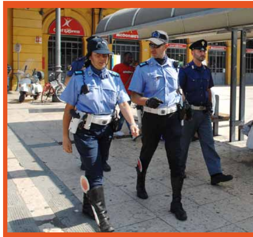
Agenti della Polizia municipale in moto e a piedi in azione per presidiare il territorio.

VIDEOSORVEGLIANZA. Modena potenzia il sistema di videosorveglianza urbana e si dota di sistemi di ripresa più flessibili in grado di essere utilizzati in tempi rapidi anche in zone non coperte da apparecchiature fisse. La novità è contenuta nel Piano di riassetto della videosorveglianza cittadina elaborato dall'assessorato alla Qualità urbana e alla sicurezza. Oltre all'aggiornamento del sistema esistente e alla creazione di una nuova centrale