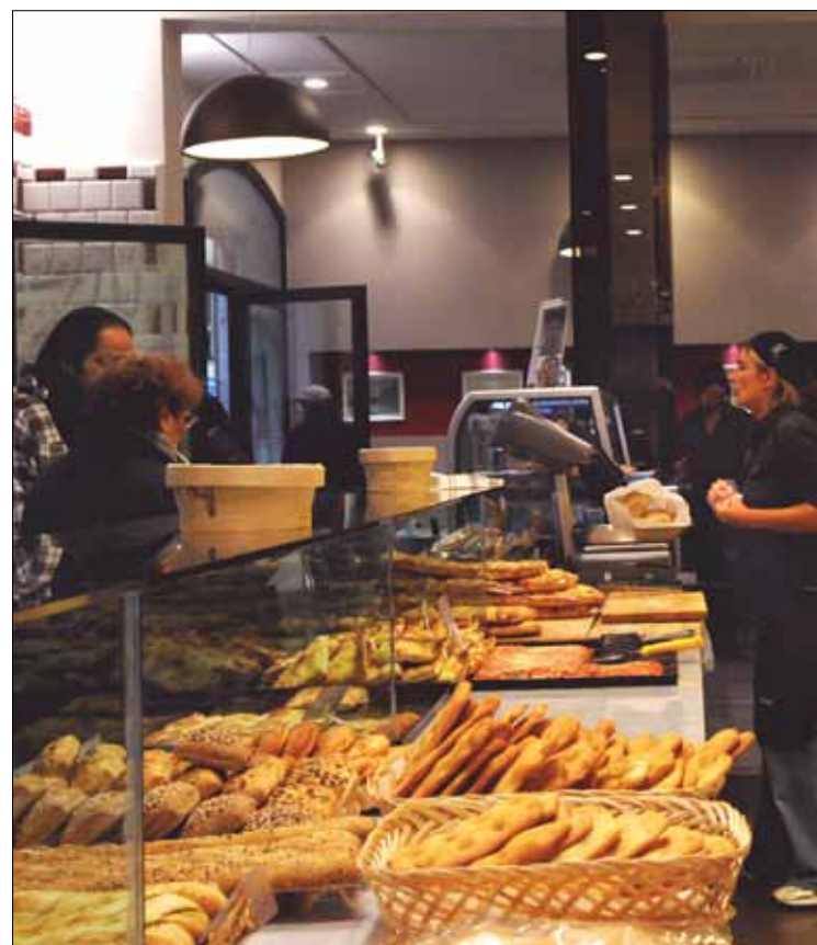
Una moderna panetteria modenese. I negozi di alimentari sono in aumento del 5,5%

A determinare l'andamento generale positivo concorrono entrambi i settori merceologici, pur con dinamica differente: il comparto non alimentare con un tasso di sviluppo del 1,6%, quello alimentare con un tasso assai più elevato: del 5,5%. Il centro storico mantiene invariata, negli ultimi tre anni, la propria dotazione commerciale pari a 897 punti vendita (136 alimentari e 761 non alimentari), ma il risultato è frutto di opposte dinamiche interne ai due comparti. Nel triennio è salito infatti il numero dei negozi alimentari con un tasso di sviluppo assai significativo, pari al 7%; viceversa è diminuito del 1,2% il numero dei non alimentari. L'aumento registrato nei negozi di abbigliamento e calzature (+1,9%), non è infatti riuscito a compensare il calo di punti vendita specializzati in altre tipologie, in particolare casalinghi, tessili, ferramenta, sanitari. In centro storico si consolida quindi l'uniformità dell'offerta merceologica non alimentare, concentrata per il 36% su abbigliamento e accessori.