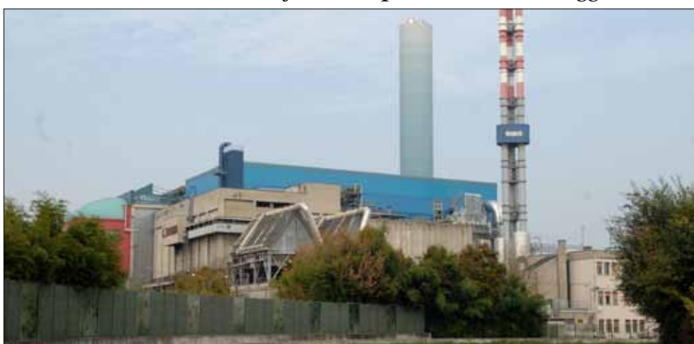
L'inceneritore di Modena con il nuovo camino. La vecchia linea sarà sostituita e l'energia recuperata dalla combustione servirà a riscaldare migliaia di case.

Oggi Modena è tra le prime 3 città italiane con oltre 150 mila abitanti per la raccolta differenziata e la percentuale avviata a smaltimento si è ridotta allo 0,2%, mentre il ricorso alle discariche sul territorio provinciale è ulteriormente sceso a poco più del 17%. Col progetto Sistema Modena