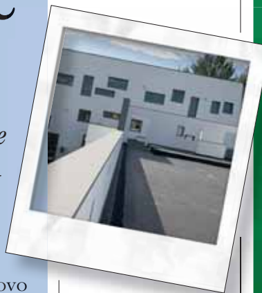
Il nuovo teatro di Cittanova. A destra l'immagine del manifesto del Festival filosofia 2009. Sotto: Il filosofo Remo Bodei, membro del comitato scientifico del Festival filosofia