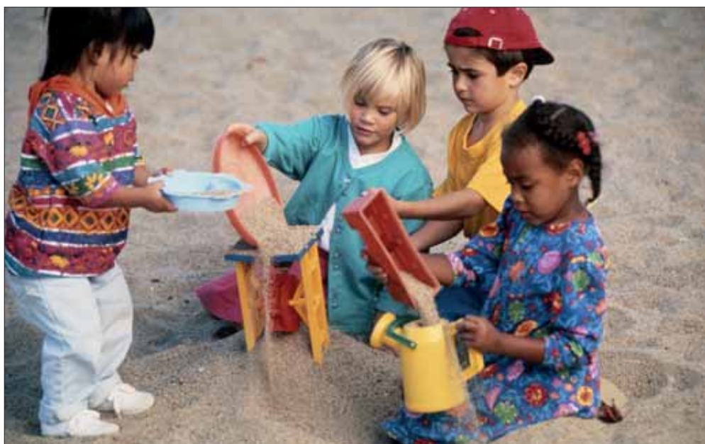
Un gruppo di bambini gioca con la sabbia in una scuola dell'infanzia di Modena

L'ufficio Ammissione del settore Istruzione contatterà gli ammessi alle scuole comunali e comunicherà a chi è in lista d'attesa la disponibilità di posti liberi. Gli ammessi alle scuole d'infanzia statali, invece, dovranno presentarsi alla Direzione didattica della scuola assegnata: per la scuola Madonnina al 3° Circolo, con sede nella scuola primaria Giovanni XXIII in via Amundsen 70; per le scuole