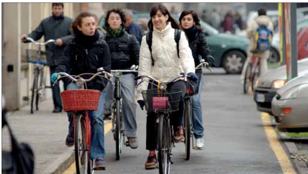
Giovani in bicicletta su una pista ciclabile

In particolare, sono in via di completamento i lavori di due nuovi tratti di ciclabile nella zona limitrofa alla linea della ferrovia: su via Cialdini - via delle Suore, all'interno della riqualificazione del comparto ex Vinacce, e su via Razzaboni fino a via sant'Anna. Il primo tratto, dall'attuale sottopasso fino alla nuova rotatoria in angolo con via Suore, misura 176 metri con un'ampiezza di 4 metri suddivisa tra corsia ciclabile e pedonale. Sarà adiacente alla sede stradale di via Cialdini, separato da un'aiuola, e permetterà il completamento della ciclabile nel nuovo comparto 'ex Vinacce', congiungendola con il tratto esistente in via Razzaboni. L'opera progettata da Comune e Tav è stata realizzata a carico di quest'ultima. Il secondo tratto completerà la rete su via Razzaboni. La chiusura del tratto fino alla