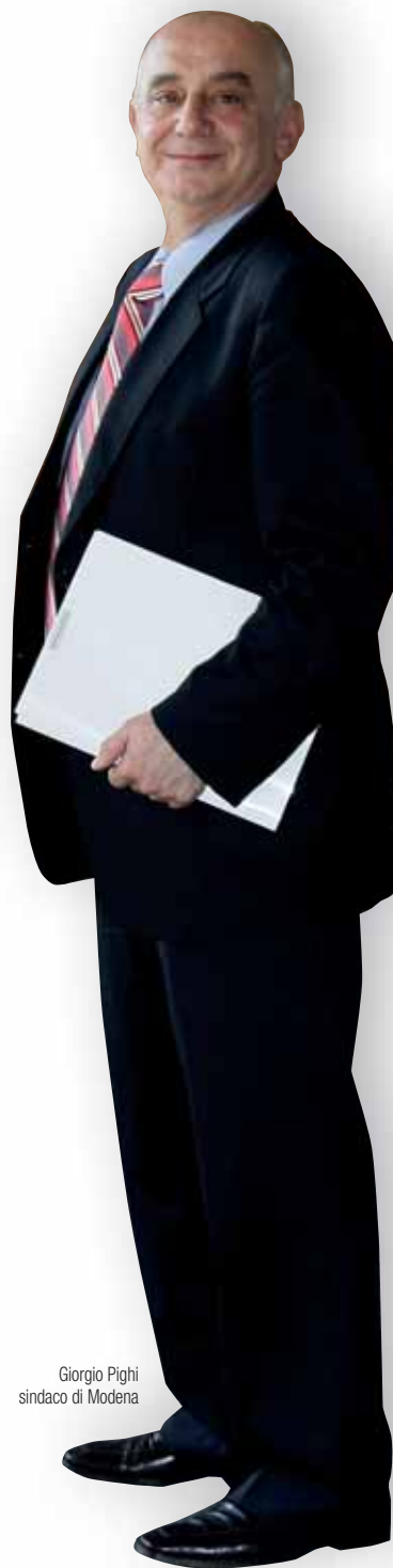
Giorgio Pighi sindaco di Modena

Accanto alla riconferma di Pighi, i risultati elettorali consegnano alla città un Consiglio comunale con soli 7 gruppi (lo scorso mandato erano 14): due di maggioranza (Pd con 23 consiglieri e Sinistra per Modena con uno) e cinque di opposizione (9 al Pdl, 4 alla Lega Nord e uno ciascuno a Unione di Centro, Lista Civica Beppegrillo e Italia dei valori).