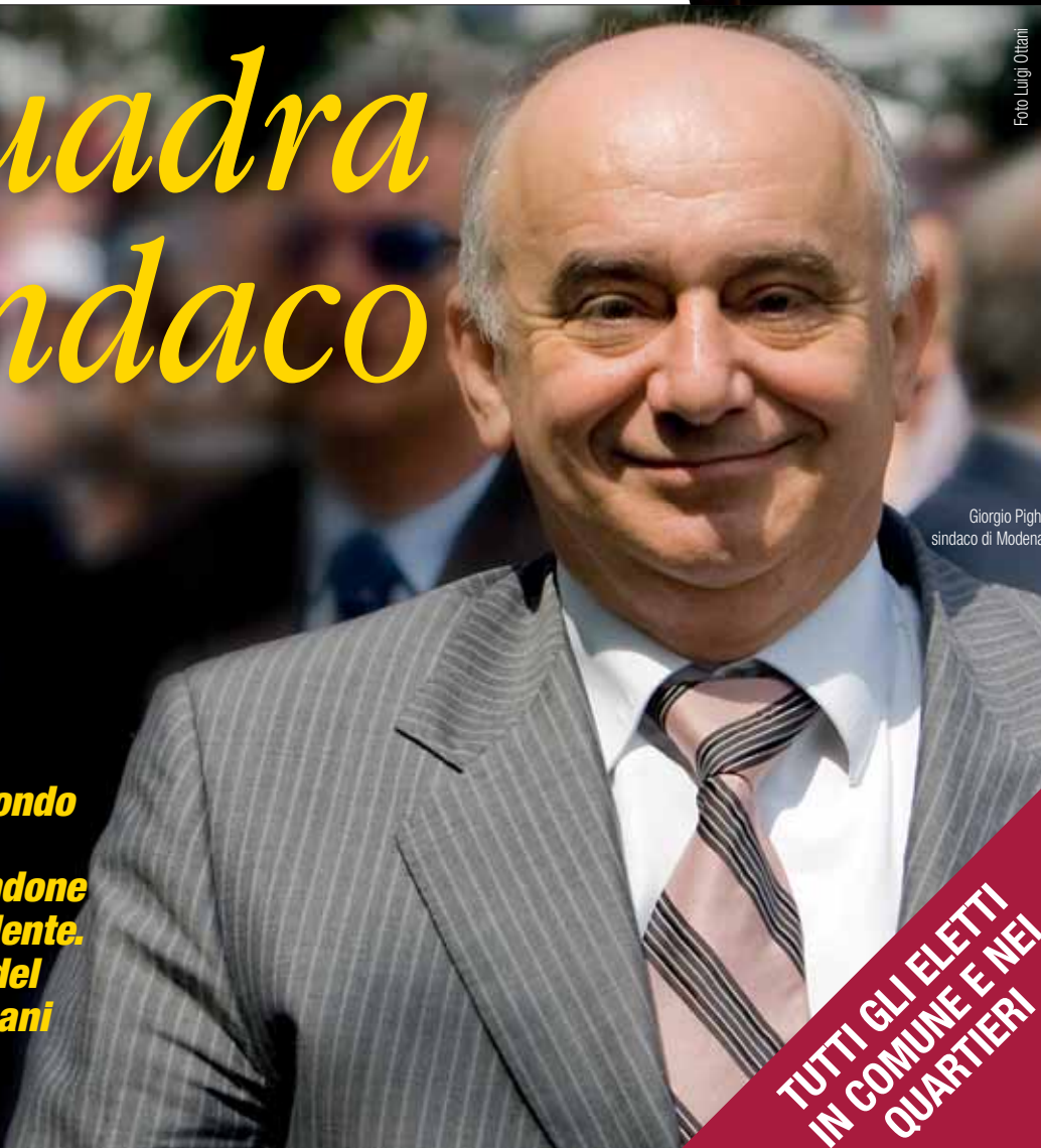
Giorgio Pighi sindaco di Modena

SPECIALE ELEZIONI DA PAGINA 3 A PAGINA 8