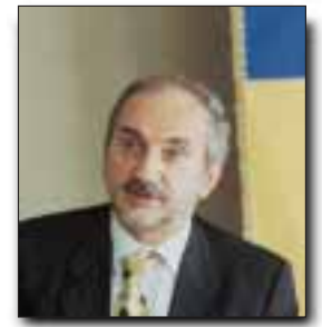
Giuliano Barbolini Sindaco di Modena

“Quella dell'ingresso in borsa è una scelta che confermiamo così come confermiamo di voler provvedere fin da ora a tutti gli adempimenti. Tutto questo, però, non vuol dire procedere comunque. Da ora e fino al prossimo dicembre 2003 sono diverse le finestre d'ingresso previste. Dobbiamo essere pronti a prendere quella più favorevole. E' evidente, però, che se la borsa non cambia l'attuale trend negativo, mediteremo a fondo prima di imboccare la nuova strada”