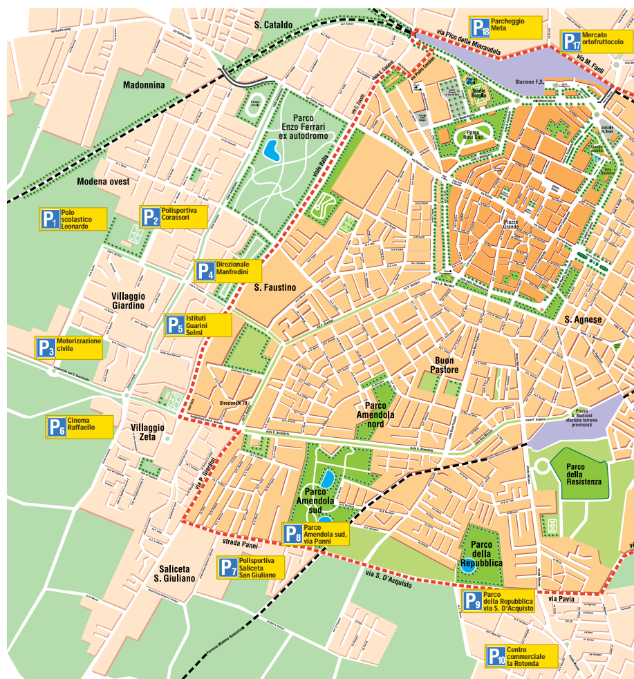
Nella cartina qui sopra l'area tratteggiata in rosso è quella in cui saranno in vigore le targhe alterne nella giornata di giovedì, mentre la domenica il provvedimento riguarderà tutto il territorio comunale. Nella foto sotto le auto elettriche comprate dal Comune di Modena.

Nel numero di ottobre di "Modena Comune" ci sarà uno speciale con tutti i dettagli della manovra anti-inquinamento