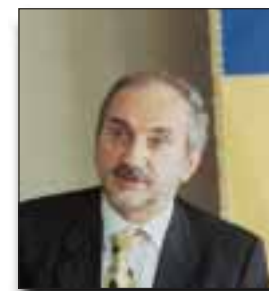
Giuliano Barbolini Sindaco di Modena

I tifosi modenesi, che accederanno allo stadio da viale Monte Kosica, oltre all'utilizzo consigliato dei bus Atcm o della bicicletta (presso il Novi Sad saranno attrezzate apposite rastrelliere), avranno a disposizione una serie di nove aree parcheggio per un totale di oltre 3000 posti auto, in un raggio di mille metri di distanza dallo stadio. Queste aree sono il Novi Sad (1095 posti), il parcheggio Meta-New Holland (310 posti), quello degli uffici comunali di via Santi (387 posti), il parcheggio sulla porta nord della stazione Fs (296 posti), il parcheggio degli uffici comunali di via Galaverna (98 posti), quello di piazza Cittadella (100 posti), quello di palazzo Europa (233 posti) e quello del parco Ferrari (500 posti). Il Comune di Modena ha definito una serie di parcheggi supplementari (per oltre 850 posti) che saranno collegati allo stadio con appositi bus (costo della corsa, andata e ritorno, 1 euro). Questi parcheggi sono lungo l'asse di viale Italia e sono il parcheggio del direzionale Manfredini (150 posti), parcheggio tra Windsor Park e direzionale Agorà 5 (213 posti), parcheggio di fronte agli istituti Selmi e Guarini (197 posti), parcheggio del direzionale Il Diamante (293 posti). Il bus effettuerà una fermata anche nel parcheggio del parco Ferrari.