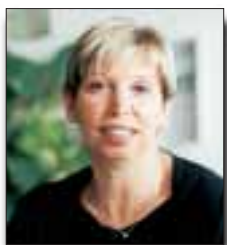
Morena Manfredini Assessore alla Pubblica Istruzione