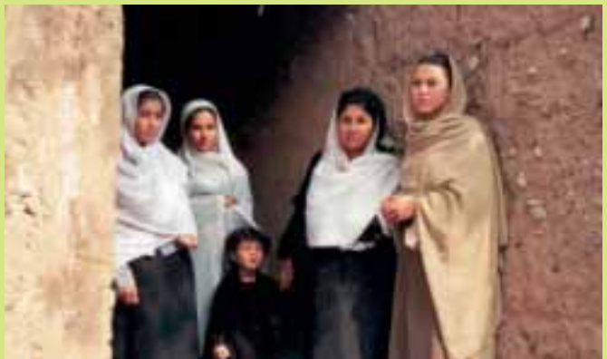
Nella foto sopra il Centro Stranieri del Comune. Qui a lato un'immagine di profughi della Commissione per la Parità e le Pari Opportunità tra Uomo e Donna

L'assessorato ai Servizi sociali e il Centro stranieri hanno messo a punto un progetto per richiedenti asilo, rifugiati e titolari di un permesso di soggiorno per motivi umanitari o di protezione temporanea condotto nell'ambito del Programma