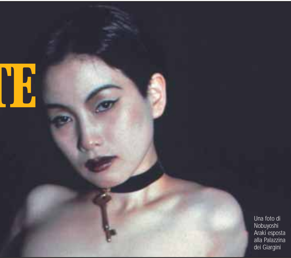
Una foto di Nobuyoshi Araki esposta alla Palazzina dei Giardini

Il mostra alla Palazzina dei Giardini le fotografie di Nobuyoshi Araki. Un racconto del Giappone e delle sue contraddizioni con immagini che interpretano in modo originale il tema della bellezza