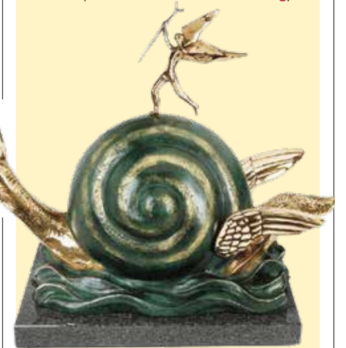
"La lumaca e l'angelo", scultura in bronzo, 1977, 151cm, tecnica: Cera persa

D all'archeologia a Salvador Dalí fino alle tecnoscienze, proseguono in ottobre le mostre e le installazioni allestite a Palazzo dei Musei e a Palazzo Santa Margherita. "Il filo d'amore e sangue" è il confine sottile che lega la vita e la morte di una bambina vissuta a Mutina nel I secolo d.C. e il titolo dell'installazione immersiva del Museo Civico che, partendo dagli oggetti ritrovati in una tomba di epoca romana, affronta il rapporto tra morte e vita grazie ai rituali legati alla cura delle anime (informazioni: museocivicomodena.it ). Nell'ala nuova di Palazzo dei Musei, invece, si può visitare "Nella mente del Maestro", un viaggio tra arte e psiche attraverso una selezione delle opere di Salvador Dalí, tra sculture, litografie, acqueforti e fotografie del maestro spagnolo. La mostra è curata da Beniamino Levi, presidente di Dalí Universe, ed è visitabile fino al 6 gennaio. A Palazzo Santa Margherita, a cura di Fmav, è in corso "Umwelt", una mostra su arte, tecnoscienza, espressioni non umane di intelligenza e ambienti collettivi naturali e artificiali. L'esposizione, curata da Marco Mancuso, espone le opere di più artisti (informazioni: www.fmav.org ).