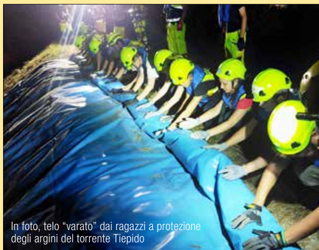
In foto, telo "varato" dai ragazzi a protezione degli argini del torrente Tiepido

Conclusa la sesta edizione del campus Esercitazioni con 24 ragazzi under 18