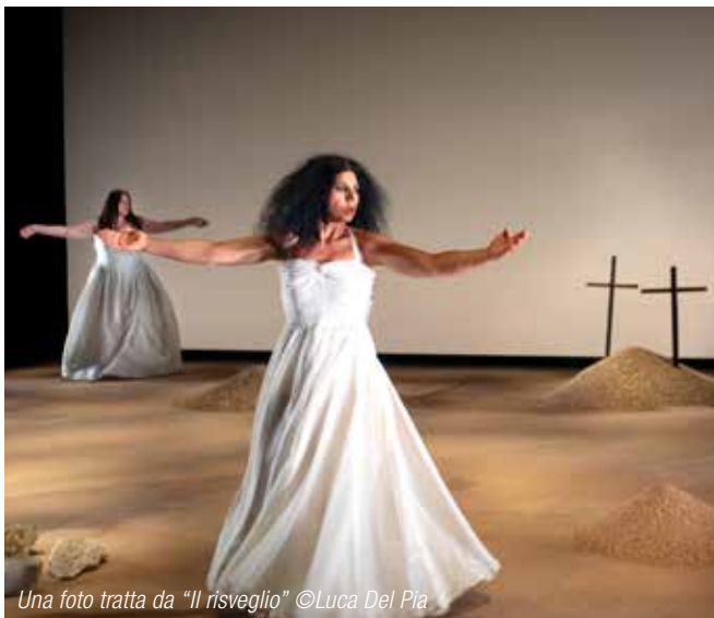
Una foto tratta da "Il risveglio"