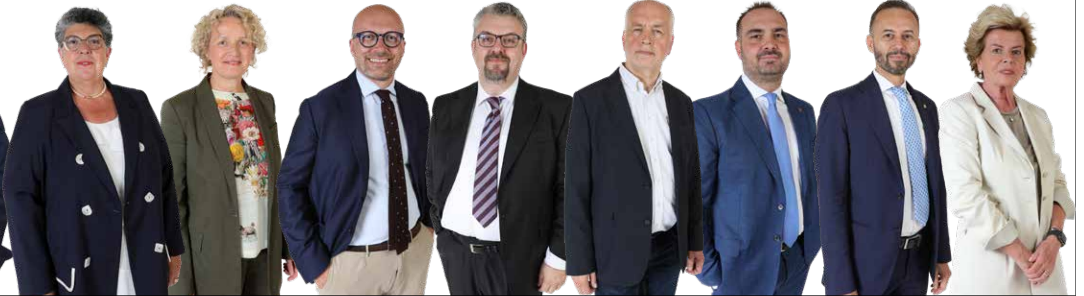
Modena Maria Grazia Modena per Modena