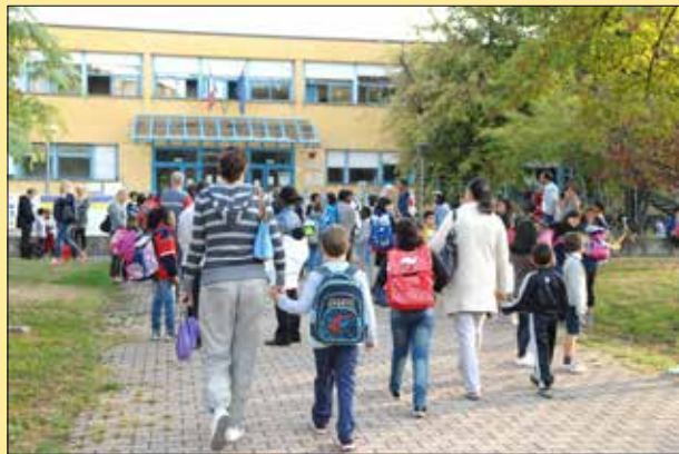
Foto di repertorio della Scuola Primaria "Cittadella"

Via anche ai servizi educativi integrativi Riduzione tariffe nido tra le agevolazioni