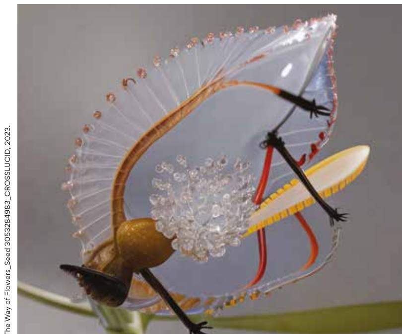
The Way of Flowers_Seed 3053284983_CROSSLUCID, 2023.