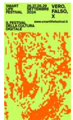
Immagine di repertorio di un'attività di Modena Smart Life Festival, che anche quest'anno indaga il rapporto tra realtà e virtualità. In basso, la locandina dell'edizione 2024

Dig Festival, festival internazionale del giornalismo investigativo, e con Ferrara Busker Festival, il festival della musica di strada più antico d'Europa, che propone un originale progetto sonoro, all'intersezione tra canto lirico, beatboxing e intelligenza artificiale, sviluppato insieme ad H-Farm. Il calendario completo è disponibile sul sito www.smartlifefestival.it e sui social del festival.