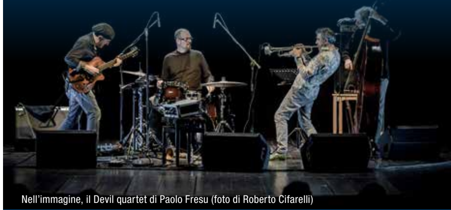
Nell'immagine, il Devil quartet di Paolo Fresu