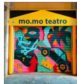
Refresh of memory, l'opera realizzata sulla serranda del Momo

educativo Momo che si affaccia su piazza Matteotti, nel centro di Modena. L'opera di street art si chiama R.O.M. "Refresh of memory" ed è uno degli esiti del progetto "Le Scale", in cui i