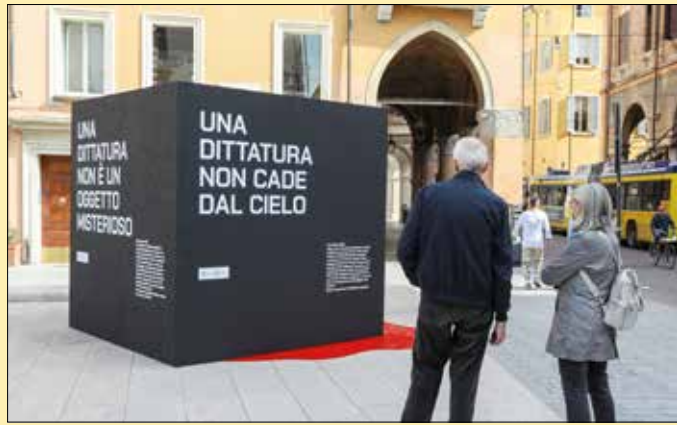
Il cubo che ricorda il delitto Matteotti e l'avvento del fascismo