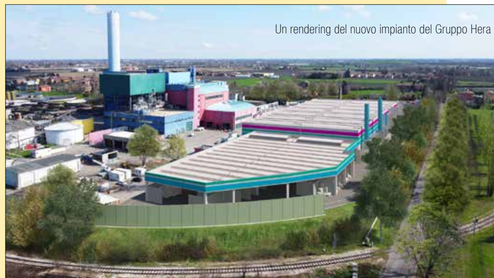
Un rendering del nuovo impianto del Gruppo Hera

tonnellate di polimeri riciclati di alta qualità, a partire da rifiuti plastici rigidi, tra i più difficili da riciclare con efficacia. Questi polimeri, anche se riciclati, avranno una purezza tale da poter essere reimpiagati pure negli stessi comparti di origine con prestazioni analoghe a quelle garantite da materiali vergini. Il metodo utilizzato da Aliplast, infatti, consiste nell'upcycling, cioè una rigenerazione che eleva la qualità del polimero di partenza, raggiungendo così caratteristiche qualitative di alto livello. In questo modo, le plastiche in uscita dall'impianto potranno far fronte a quelle esigenze che fino ad oggi trovano risposta quasi esclusivamente nelle materie prime vergini: anche settori caratterizzati da significativi impatti ambientali potranno così incrementare la propria sostenibilità. Basti pensare che la quantità di plastica riciclata in un anno dall'impianto a regime permetterà di risparmiare all'ambiente emissioni per circa 30 mila tonnellate equivalenti di CO2.