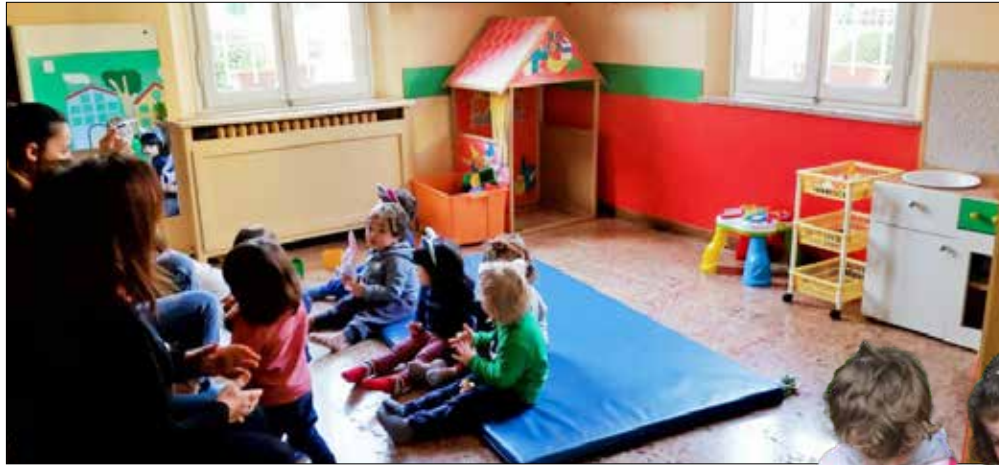
Due immagini dei nidi d'infanzia modenesi: "La Casa" di via Monte Sabotino e il "Grillo parlante" di via Tomaso da Modena

A Modena, dei 780 posti disponibili, 729 vengono assegnati subito, i rimanenti 51, insieme ai 12 di nuova attivazione, verranno proposti a breve alle famiglie rimaste in lista di attesa, mentre l'ammissione dei bambini non residenti potrà avvenire solo dopo aver soddisfatto le