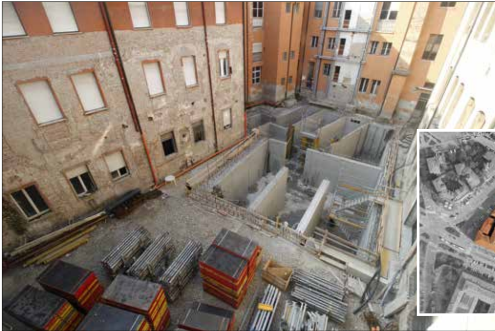
Una veduta dall'alto del complesso dell'ex ospedale Sant'Agostino e gli interventi in corso alla centrale tecnologica del complesso