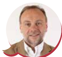
Giovanni Silingardi (Movimento 5 stelle)