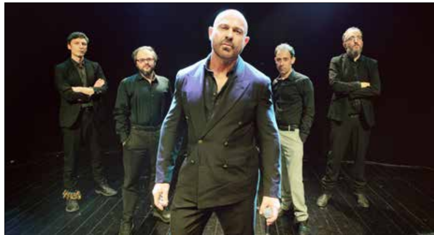
Nelle tre immagini, Omar Sosa, i Virtuosi italiani e Raiz con la band che lo accompagna

concerto classico con i più celebri autori del repertorio barocco veneto: Tomaso Albinoni, Giuseppe Tartini e Antonio Vivaldi. A interpretarlo i Virtuosi italiani, formazione regolarmente invitata nei più importanti teatri, festival e stagioni in tutto il mondo, dalla Konzerthaus di Vienna al Teatro alla Scala. Omar Sosa, uno dei pianisti più noti e più versatili della scena jazzistica mondiale, sarà a Modena venerdì 21 per un recital solistico, col suo inconfondibile stile che fonde elementi world music ed elettronici con le radici afrocubane. Impegnato in tutto il mondo con tournée che arrivano fino a cento concerti l'anno, è stato ospite in tutte le maggiori manifestazioni, dal festival di Montreux al Blue Note di New York.