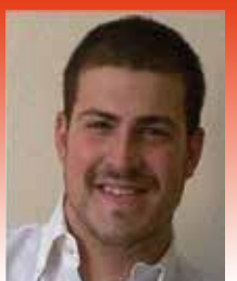
PER RESIDENZIALE RICCARDO

ex Albo Mediatori Creditizi n° 63853-69939