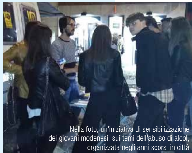
Nella foto, un'iniziativa di sensibilizzazione dei giovani modenesi, sui temi dell'abuso di alcol, organizzata negli anni scorsi in città