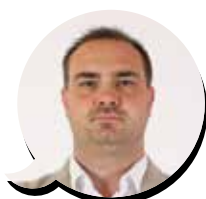
Piergiulio Giacobazzi (Forza Italia)