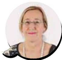
Enrica Manenti (Movimento 5 Stelle)