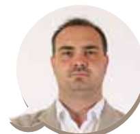
Piergiulio Giacobazzi (Forza Italia)