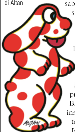
La Pimpa di Altan