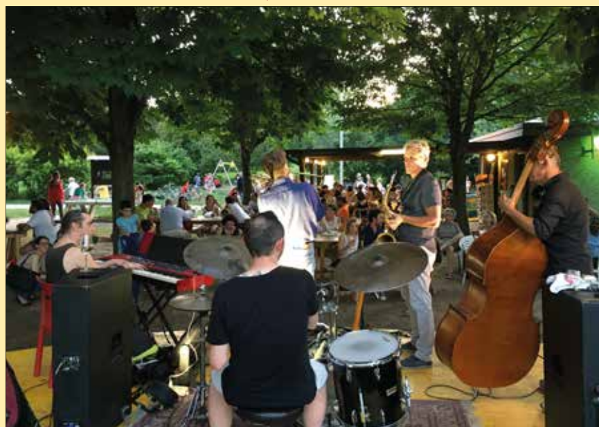
Serata di blues al Millybar