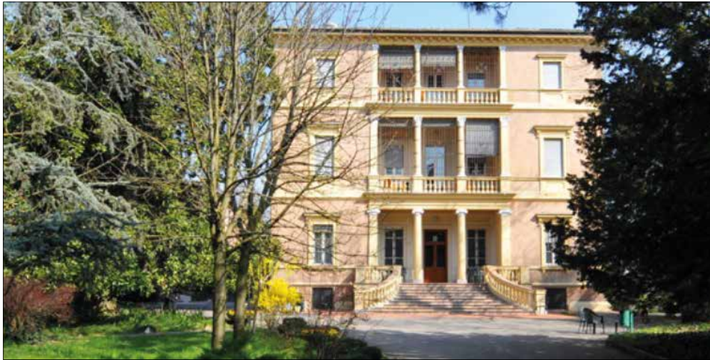
Una vista della sede storica di Villa Igea in via Stradella alle porte di Modena

Villa Igea spa ebbe origine nel 1937 e fu fondata per la cura delle malattie