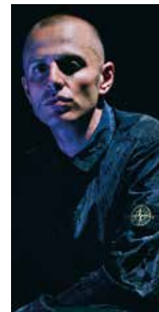
Sopra, il rapper cantautore Ghemon, ospite alla Festa della Musica; a sinistra, la band dei Babel Fish

La Piattaforma in collaborazione con il Centro Musica: sul palco giovedì 21 giugno ci sarà il rapper Ghemon, oltre a giovani artisti emergenti selezionati da Sonda, progetto regionale coordinato dal Centro Musica di Modena e rivolto a musicisti che propongono un repertorio originale. Riconfermato anche in questa edizione il Festival di Orchestre Giovanili "Youth Festival", in piazza Roma, che completa il programma assieme alle proposte giunte da associazioni e commercianti del centro storico. Per informazioni: 71MusicHub_Centro Musica, tel. 059 2034810, www.musicplus.it - facebook.com/centromusicamo