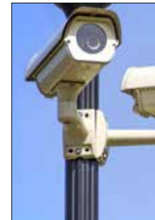
Foto di gruppo con i coordinatori di gruppi di Controllo di Vicinato attivi in città, il sindaco Gian Carlo Muzzarelli e la vicecomandante della Polizia municipale Patrizia Gambarini. Sotto, telecamera per video sorveglianza

Nella stessa occasione il sindaco ha sottolineato come di fronte alla "domanda di sicurezza e legalità che viene dai nostri concittadini, vogliamo difenderci insieme alle Forze dell'Ordine. Non mi basta sapere che in casa posso armarmi e difendermi - ha affermato - Voglio avere la certezza e la serenità che anche i miei vicini mi sono vicini, che insieme possiamo prevenire, denunciare, aiutarci".