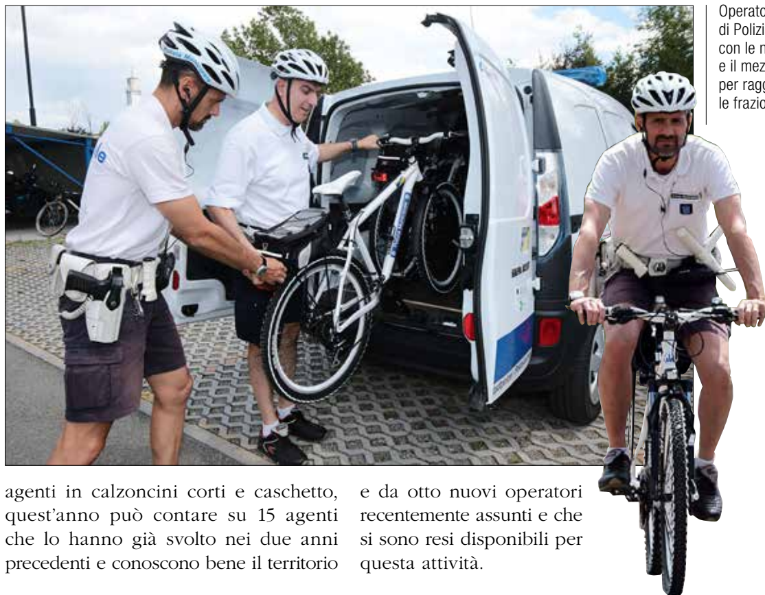
Operatori di Polizia municipale con le nuove bici e il mezzo elettrico per raggiungere le frazioni

agenti in calzoncini corti e caschetto, quest'anno può contare su 15 agenti che lo hanno già svolto nei due anni precedenti e conoscono bene il territorio