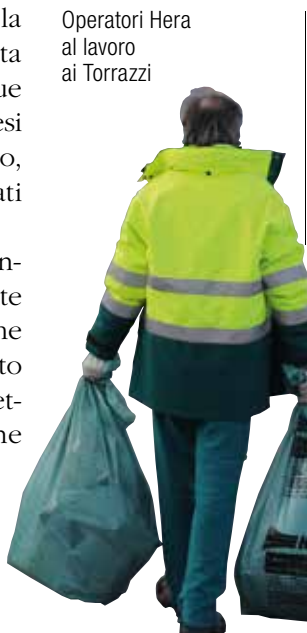
Operatori Hera al lavoro ai Torrazzi

La raccolta porta a porta ai Torrazzi coinvolge oltre 500 utenze, prevalentemente produttive e in parte minore domestiche (circa il 20 per cento), alle quali è stato consegnato il kit per effettuare correttamente la differenziata che contiene il calendario delle raccolte, pattumelle per organico e vetro, sacchi per le diverse frazioni di differenziata. Alle imprese che producono volumi previsti particolarmente significativi sono stati consegnati cassonetti fino a 1.700 litri di capienza, per agevolare la gestione dei rifiuti. Il nuovo servizio è propedeutico all'introduzione della tariffa puntuale (secondo quanto previsto dalla legge regionale dello scorso ottobre) e si propone obiettivi specifici e immediati: disincentivare l'abbandono dei rifiuti a fianco dei cassonetti stradali e migliorare la qualità e quantità dei rifiuti raccolti. "Le Zai - commenta Giulio Guerzoni, assessore comunale all'Ambiente - con oltre 6.600 tonnellate all'anno di rifiuti raccolti rappresentano la parte forse più consistente del Piano Ambiente di Modena. Il nostro obiettivo è portare al 75 per cento la percentuale di differenziata che oggi,