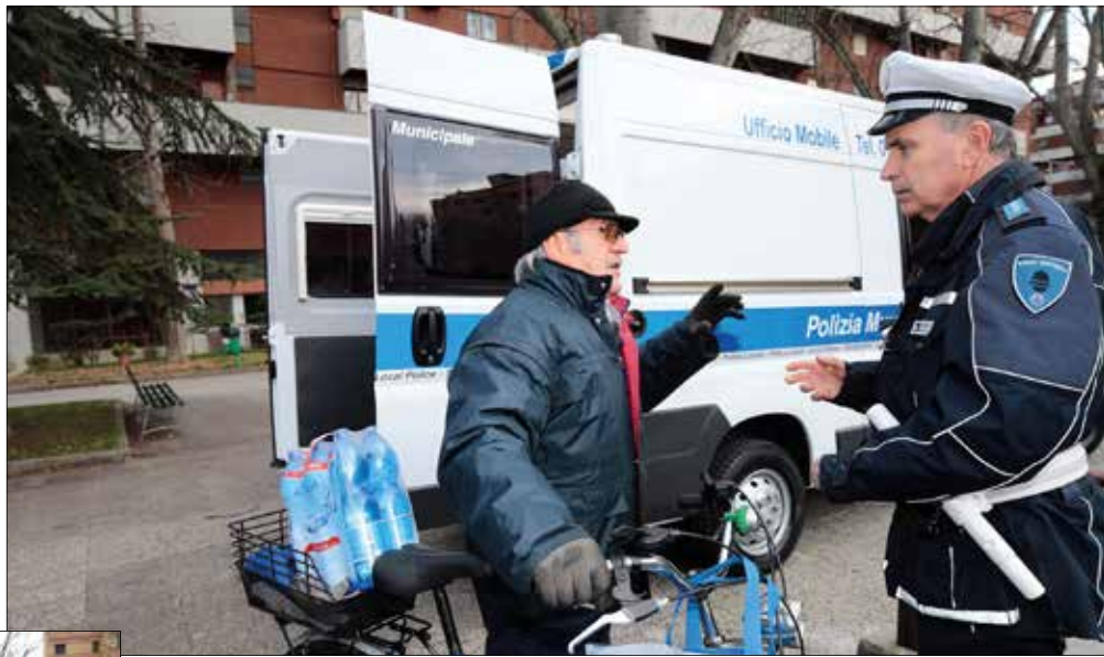
A sinistra e sotto, cittadini chiedono informazioni a operatori della Polizia municipale, presenti nei quartieri con il nuovo ufficio mobile

In questa logica vanno letti anche l'incremento di percorsi appiedati, controlli nei parchi, servizi anti degrado e di con-