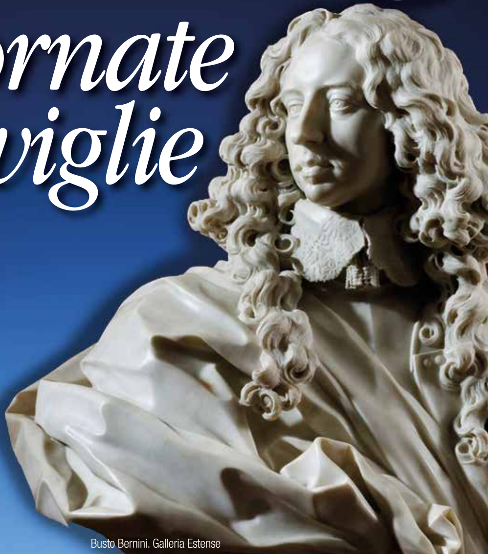
Busto Bernini. Galleria Estense