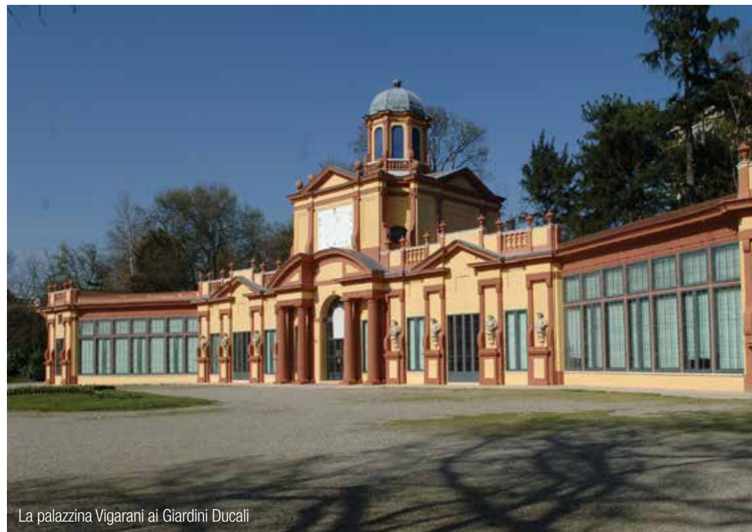
La palazzina Vigarani ai Giardini Ducali

A Milano arriva l'Expo e Modena dal 9 maggio al 20 settembre ospita ai Giardini Ducali e alla Palazzina Vigarani un festival di cinque mesi per esaltare la vocazione gastronomica del territorio e i suoi prodotti Dop e Igp. Nasce da un'ispirazione dello chef Massimo Bottura la rassegna “Piacere Modena, i giardini del gusto e delle arti”: oltre 130 appuntamenti, tutti i giorni, quasi tutti gratuiti. Incontri, show cooking, master class, concerti, spettacoli teatrali e animazioni per famiglie e bambini coinvolgeranno chef stellati, artisti, musicisti, intellettuali, scrittori, giornalisti del panorama locale, nazionale e internazionale. Il tema cibo sarà declinato da artisti (Lella Costa, Serena Dandini, Frankie Hi-Nrg, Don Pasta, gli Oblivion, il Fantateatro), scrittori (Massimo Carlotto, Simonetta Agnello Hornby), viaggiatori eccellenti (i “Turisti per caso” Patrizio Roversi e Syusy Blady), filosofi (Marino Niola, Vito Mancuso), agronomi (Eraldo Antonini, Stefano Mancuso), professori universitari (Massimo Montanari, Stefano Magagnoli), scienziati e ricercatori (Mario Tozzi, Davide Tabarelli, Piergiorgio Odifreddi). Interverranno esperti di cibo e cucina, come Allan Bay, Sonia Peronaci, Lisa Casali, Andrea Segrè. Ci saranno le lectio