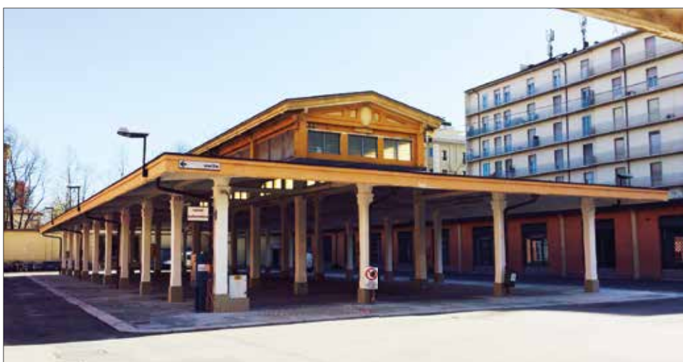
Sopra, a sinistra il parcheggio all'ex Amcm in via Carlo Sigonio; a destra e qui a fianco il parcheggio all'ex Moi, mercato ortofrutticolo, di via Ciro Menotti