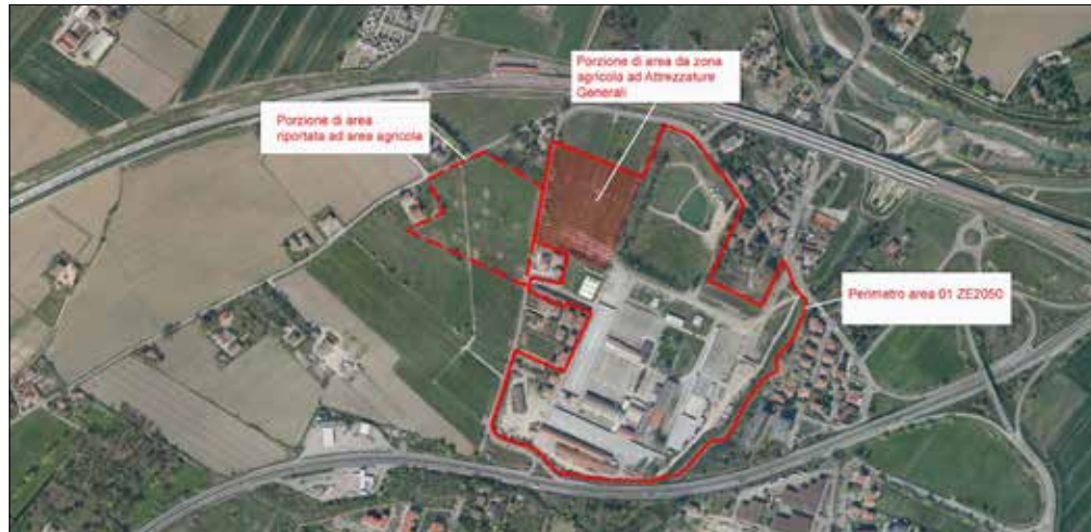
Vista aerea dell'area del Ponte Alto interessata dalla variante. Sotto Cimitero per animali all'estero