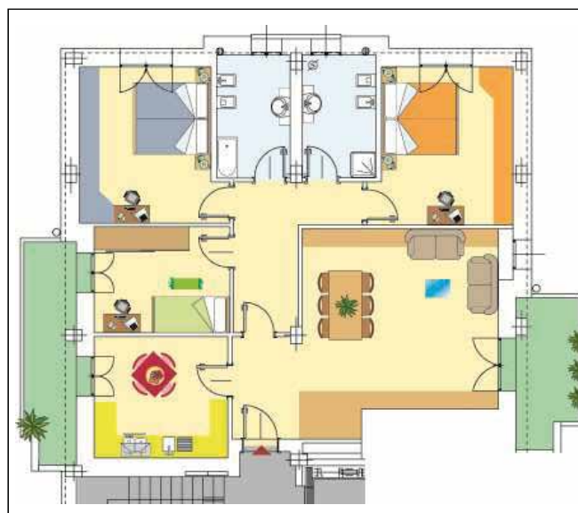
ALLOGGIO CON SOFFITTA E GARAGE DOPPIO 170 mq - Euro 278.000 iva esclusa

Modena PEEP SAN DAMASO via Scartazzetta Palazzina di 12 alloggi a prezzi convenzionati - Ultime Soluzioni Disponibili