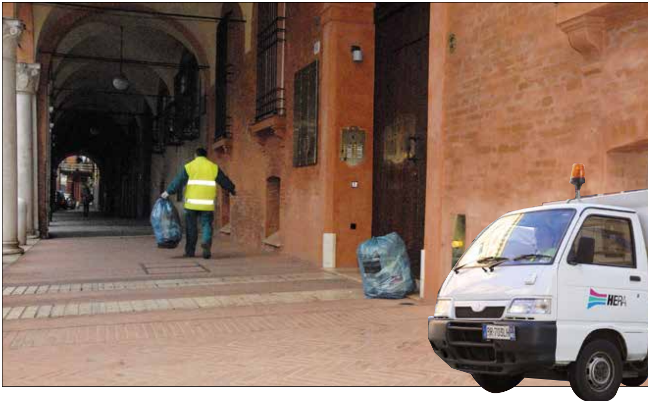
Raccolta dei rifiuti nei portici del centro cittadino

Queste azioni hanno portato buoni risultati e ora si avvia la seconda fase del progetto, con l'estensione del porta a porta a tutto il centro storico, l'eliminazione dagli androni, per maggiore sicurezza, del servizio di raccolta del vetro, che dovrà essere conferito nelle mini isole stradali, e il completamento di queste ultime con analoghi contenitori di arredo urbano per l'indifferenziato, eliminando gradualmente gli attuali cassonetti. In particolare, il porta a porta interesserà a partire dal 12 maggio anche tutta la zona compresa entro le mura tra i viali, via Belle Arti, Piazza Roma e Via San Giovanni del Cantone e coinvolgerà 5.600 utenze, prevalentemente domestiche. Di queste, 1.500 rientrano nell'area sperimentale di via Carteria e sono già servite porta a por-