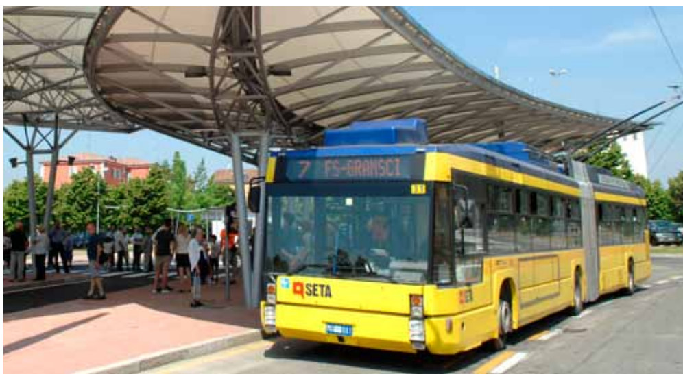
A sinistra, il nuovo bus terminal di via Gottardi, recentemente inaugurato; sotto, uno dei progetti degli studenti del Guarini che sarà realizzato dal Comune di Modena

Altri adeguamenti interessano le linee dirette alla zona nord - est della città: la linea 12 non percorre più via Finzi ma si dirige verso la zona Santa Caterina, dove sostituisce buona parte dell'attuale percorso della 14; la linea 14 va a sostituire la 3A in zona Cavo Argine - Portorico e la 3 abbandona di conseguenza il capolinea Portorico (eccetto festivi). La linea 4 non transita più in Piazza Roma, come previsto dal progetto di pedonalizzazione. Piccolo scambio di "ruoli", inoltre, tra le linee 8 e 1 in zona Verdi - Puccini, per linearizzare i rispettivi percorsi: la linea 1 non passa più per Largo Garibaldi, dove transita invece