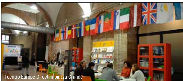
Il centro Europe Direct in piazza Grande

Si estende su trecento metri quadrati ricavati dagli spazi dell'ex ospedale Estense la nuova sala polifunzionale dei Musei civici di Modena. È dotata di impianto di riscaldamento e illuminazione a basso impatto energetico, attrezzata per proiezioni audiovisive e ulteriormente divisibile grazie all'uso di pareti mobili. Per tutti i fine settimana di marzo, la nuova sala ospita il ciclo di conferenze “Metti un pomeriggio al museo...”, con approfondimenti sulle ultime scoperte archeologiche del modenese e sulle mostre in corso e laboratori per i più piccoli (il programma completo è sul sito www.comune.modena.it/museoarte ). Tra le novità ai Musei civici c'è anche la convenzione con il Touring club, grazie alla quale 38 volontari (nella foto) collaboreranno nell'apertura degli spazi espositivi e nell'assistenza al pubblico.