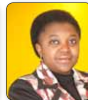
Cecile Kyenge Pd