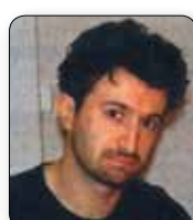
Michele dell'Orco Movimento 5 stelle