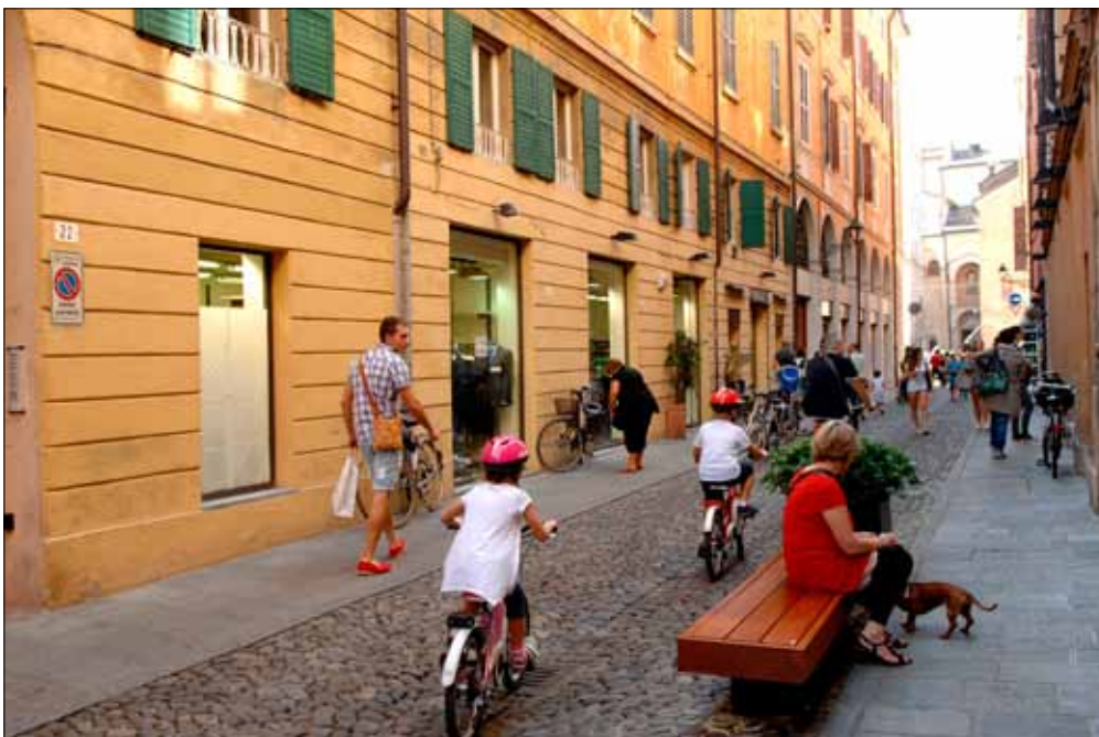
Pedoni e arredo urbano in via Cesare Battisti, dove è stata vietata la sosta delle auto

del trasporto pubblico" (dal 12 al 17 novembre nelle prime ore del mattino saranno distribuiti 3 mila biglietti gratuiti del bus ai parcheggi Ferrari e Gottardi, ndr). Per quanto riguarda la mobilità sostenibile, Sitta ha ricordato che "sono attualmente 4 mila le bici elettriche che circolano a Modena gra-