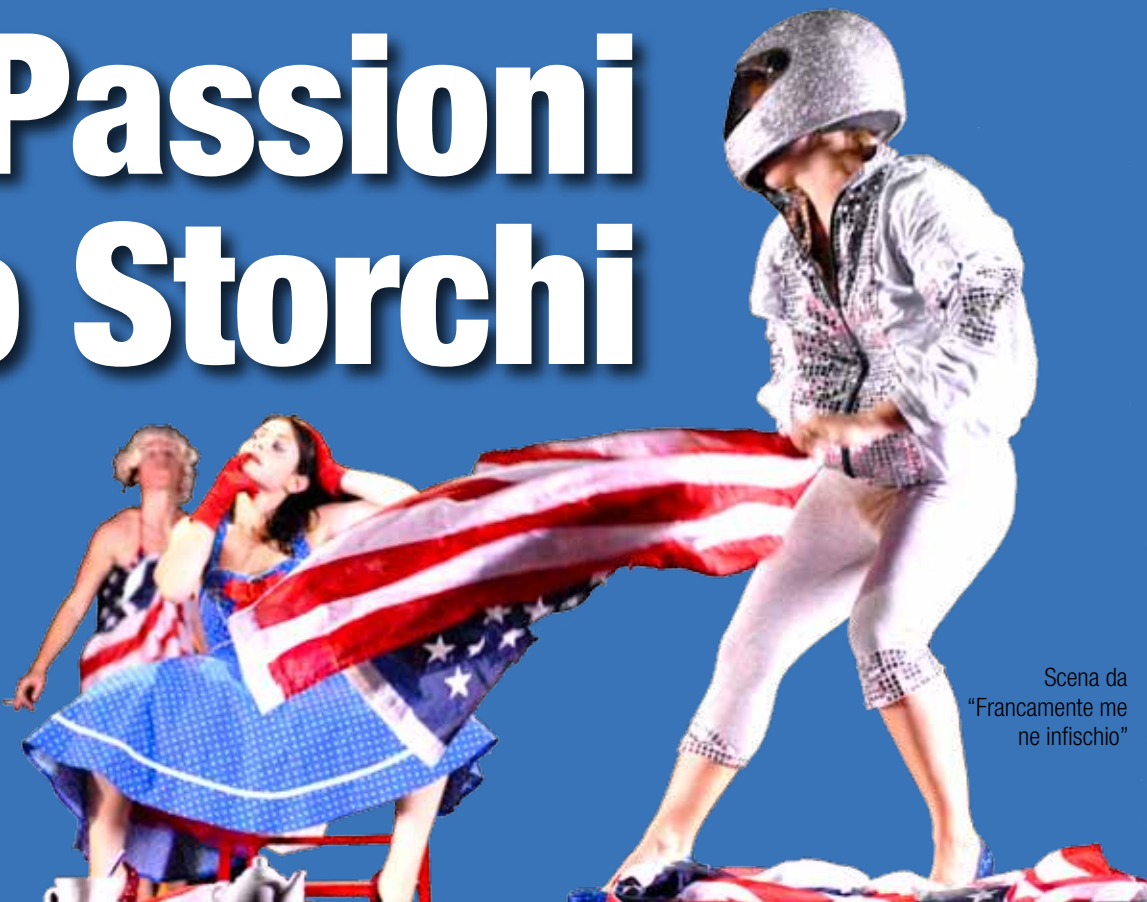
Scena da "Francamente me ne infischio"

alle Passioni, che ospitano dal 4 aprile Exit di Fausto Paravidino. Giampiero Solari dal 20 aprile dirige Alessio Boni, Alessandro Haber e Gigio Alberti in Art di Yasmina Reza allo Storchi, dove dal 2 al 5 maggio ritroviamo Luca Zingaretti, attore e regista di Torre d'avorio .