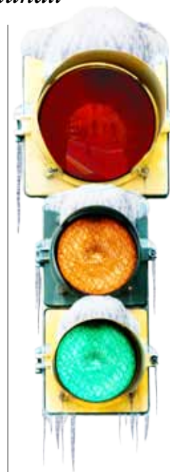
Spazzaneve in azione con il giallo e con il rosso del semaforo della neve. Da quest’anno li coordina il Comune

rischiano sanzioni da 39 a 80 euro. Informazioni dettagliate sul Piano neve sono disponibili sulla rete civica ( www.comune.modena.it ), dove si trova anche l’ordinanza sull’obbligo di pneumatici e catene a bordo ( www.comune.modena.it/monet/vado-in-comune/ordinanze ). L’Ufficio relazioni con il pubblico risponde al numero 059 20312 e la Polizia municipale al numero 059 20314.