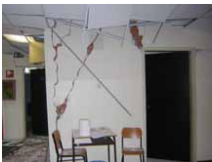
I corridoi delle scuole superiori Calvi di Finale Emilia. A destra, i lavori al Tempio monumentale di Modena, rimasto chiuso alcuni giorni dopo le prime scosse per il cedimento di decori.