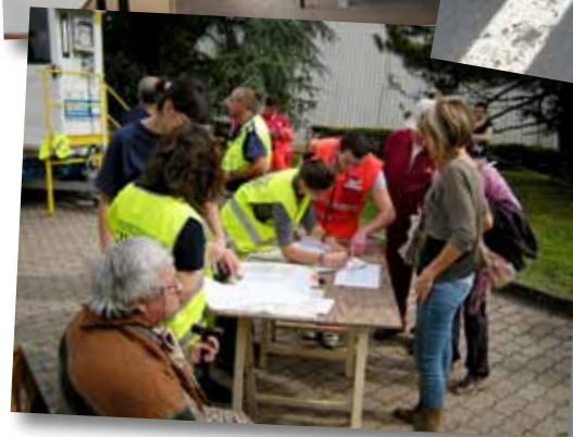
Attività al Campo di finale Emilia gestito dalla Protezione civile del Comune di Modena. Sopra un particolare di un ponte nella zona di Finale e un'aula delle scuole Galilei di Mirandola.