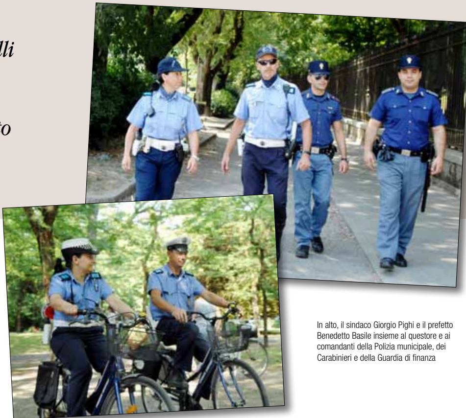
In alto, il sindaco Giorgio Pighi e il prefetto Benedetto Basile insieme al questore e ai comandanti della Polizia municipale, dei Carabinieri e della Guardia di finanza

A un anno dalla firma sottoscritti due nuovi protocolli per la videosorveglianza, la prevenzione e l'aiuto alle vittime di reati. Il dibattito in Consiglio comunale