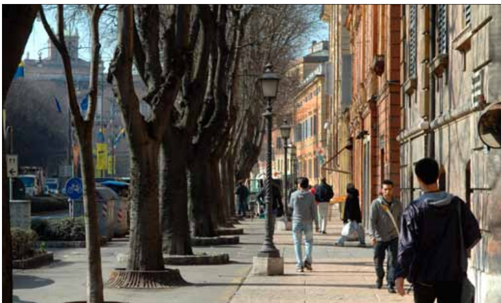
Passeggiata in corso Vittorio Emanuele, una delle strade della Zona Tempio. Sotto: il nuovo Museo casa Enzo Ferrari

Le domande di partecipazione devono essere inviate al Servizio attività