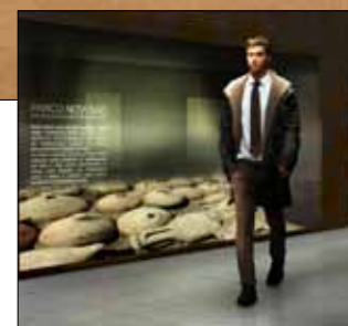
Simulazioni del nuovo parco archeologico Novi Ark

lunedì e quello antiquario troveranno spazio su un doppio anello che lascerà liberi parcheggi auto davanti al Palazzetto di viale Molza e dietro la Tenda in viale Monte Kosica.