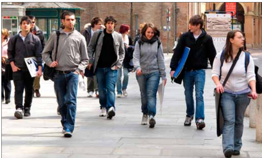
Ragazzi e ragazze in centro storico a Modena. Il Comune, per la Regione Emilia-Romagna, coordinerà diverse iniziative rivolte ai giovani. Sotto: Luciana Littizzetto, che concluderà al Forum Monzani una giornata sull'obesità infantile.