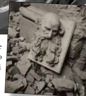
Due immagini dei bombardamenti tratte dal volume Modena città aperta .

case di civile abitazione, se ne vadano distrutte col sacrificio in più di poveri cittadini inermi ed inoffensivi”. L'opera dattiloscritta di Pedrazzi è conservata in due copie, una nel fondo Tonini della biblioteca civica d'arte Luigi Poletti e l'altra nelle raccolte dell'Istituto storico di Modena.