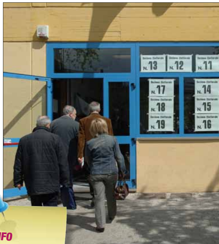
Una delle 187 sezioni elettorali di Modena in cui si voterà per i referendum del 12 e 13 giugno

Il servizio può essere prenotato entro il 6 giugno all'Urp di piazza Grande (tel. 059 20312) o all'associazione Pubblica Assistenza Croce Blu di via Giardini 481 (tel. 059 343156).