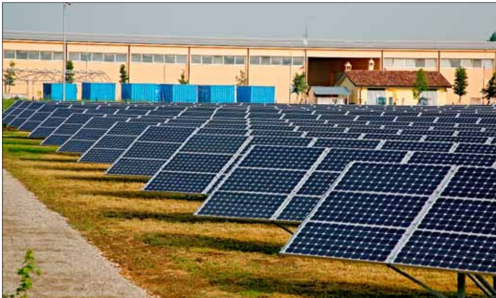
Il nuovo parco fotovoltaico inaugurato a Marzaglia. Sotto: un piatto ritrovato durante gli scavi archeologici al san Paolo

L'impianto di Marzaglia si rivelerà utile anche per i cittadini e le imprese di costruzione di Modena per rispettare il Regolamento urbanistico edilizio, secondo il quale ogni unità immobiliare costruita dopo marzo 2008 deve essere corredata da sistemi a fonti rinnovabili di potenza pari ad almeno 1 kW. Sarà, infatti, possibile acquistare "quote di potenza", per soddisfare gli standard urbanistici o per ottenere la riduzione degli oneri di urbanizzazione secondaria sino a un massimo del 50% della somma complessiva stabilita con legge regionale.