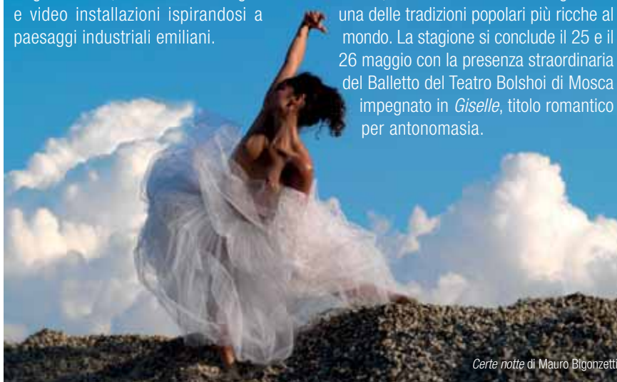
Certe notti di Mauro Bigonzetti

L'11 maggio il Balletto della Compagnia Anita y Vale Tango presenta Tango Baile , un viaggio nel tempo attraverso il mutare delle musiche, dei costumi e delle coreografie di una delle tradizioni popolari più ricche al mondo. La stagione si conclude il 25 e il 26 maggio con la presenza straordinaria del Balletto del Teatro Bolshoi di Mosca impegnato in Giselle , titolo romantico per antonomasia.