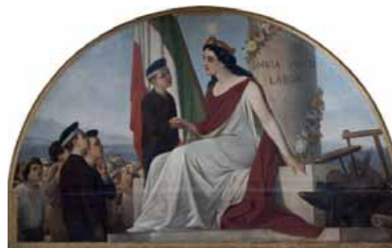
In questa pagina, immagini della mostra di Ana Maria Bresciani e di Christian Holstad, in corso a Palazzo santa Margherita. Sotto: immagini della mostra "People", aperta al Museo della Figurina

Si tratta del quarto appuntamento della nuova edizione di Area Progetto, iniziativa dedicata alla creatività giovanile emergente promossa dalla Galleria in collaborazione con