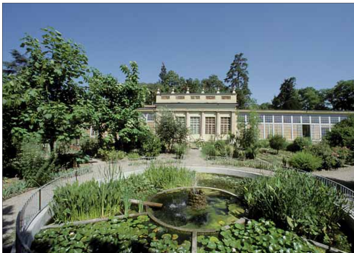
L'orto botanico di Modena