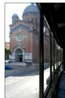
La zona Tempio in due scatti di Luigi Ottani

conosciuti e integrati anche al di fuori della comunità di origine. È più integrato, in genere, chi anche nel paese d'origine viveva in un contesto urbano, e magari è arrivato in Italia avendo già un titolo di studio o un buon livello di istruzione. Per le donne, un formidabile strumento di integrazione risultano essere proprio i figli, per la cura dei quali si comincia a uscire di casa e interagire con altre madri, con la scuola o con i servizi comunali. Ed è proprio sui ragazzi nati in Italia da genitori stranieri che, secondo la ricerca, le amministrazioni dovrebbero investire, in modo da consolidare in loro un senso di appartenenza alla città di Modena.