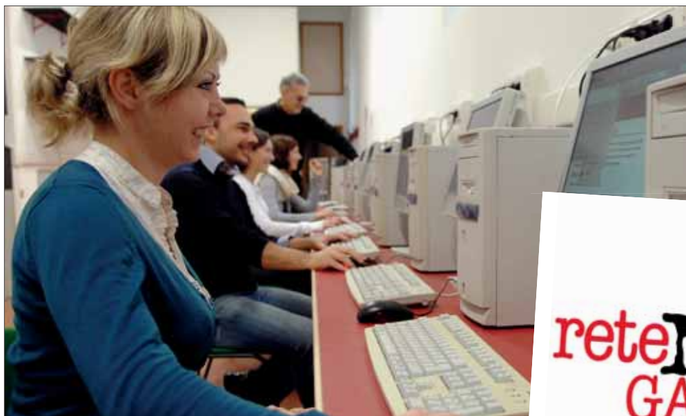
Giovani navigano in un net garage di Modena

E intanto già ci si prepara alla nuova stagione di corsi. Nove quelli che partiranno dalla metà di ottobre in poi: da Open Office.org a Gimp per l'editing di immagini, a Ubuntu Linux, tutti sugli applicativi in ambiente Linux, il sistema operativo libero alla cui diffusione intende contribuire la rete dei Net Garage. I corsi, le cui informazioni dettagliate sono consultabili in internet ( www.comune.modena.it/netgarage ), partiranno subito anche al Net Garage 2.0, che inaugura a metà mese presso il complesso di Windsor Park, accanto