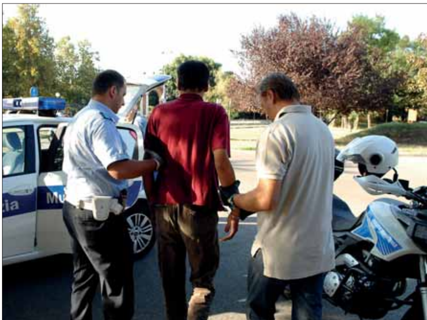
Controlli della Polizia municipale e, sotto, lavori di ristrutturazione al condominio Rnord di via Attiraglio

dei parchi, la regolarità del commercio, la buona convivenza, il controllo della sicurezza stradale.