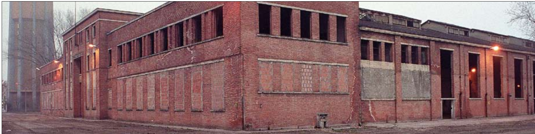
Le ex fonderie di Modena