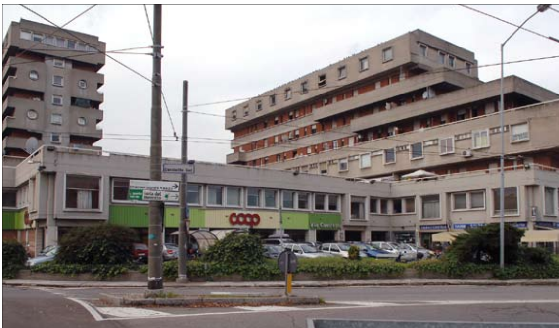
Il condominio Errenord di via Attiraglio

L'impatto sociale dell'edificio Errenord va a incidere sulla sicurezza della zona e un miglioramento di questo condominio attraverso il Contratto di quartiere andrà senza dubbio ad aiutare un recupero della qualità di tutto il quartiere nel suo complesso. L'obiettivo di questo importante progetto è quello di migliorare la sicurezza sociale degli abitanti: i cittadini che abitano nel quartiere hanno il diritto di sentirsi più sicuri".