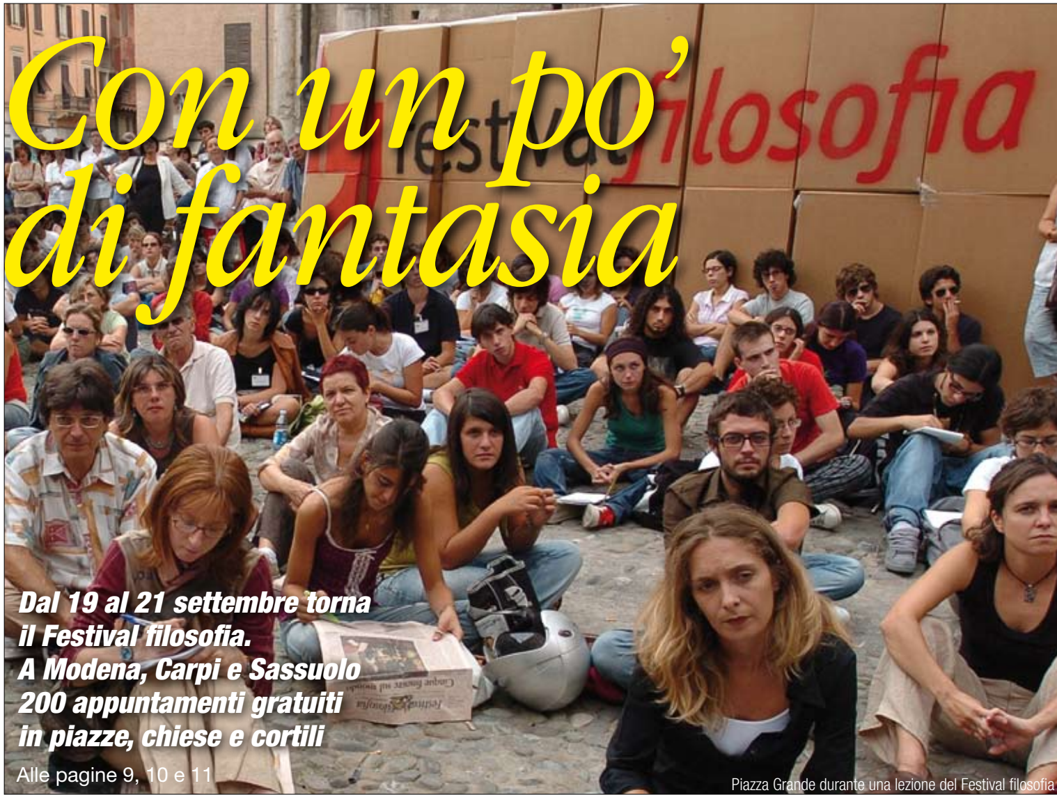
Piazza Grande durante una lezione del Festival filosofia