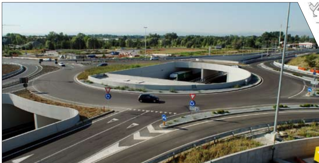
Un'immagine della rotatoria di via Emilia, e, sotto, la rotatoria di Ciro Menotti durante gli ultimi lavori

Novità nella circolazione stradale: in viale Ciro Menotti, in viale Trento Trieste e in una parte di viale Reiter si viaggia in automobile in entrambe le direzioni. Terminati i lavori alle rotatorie di via Emilia e via Bonacini