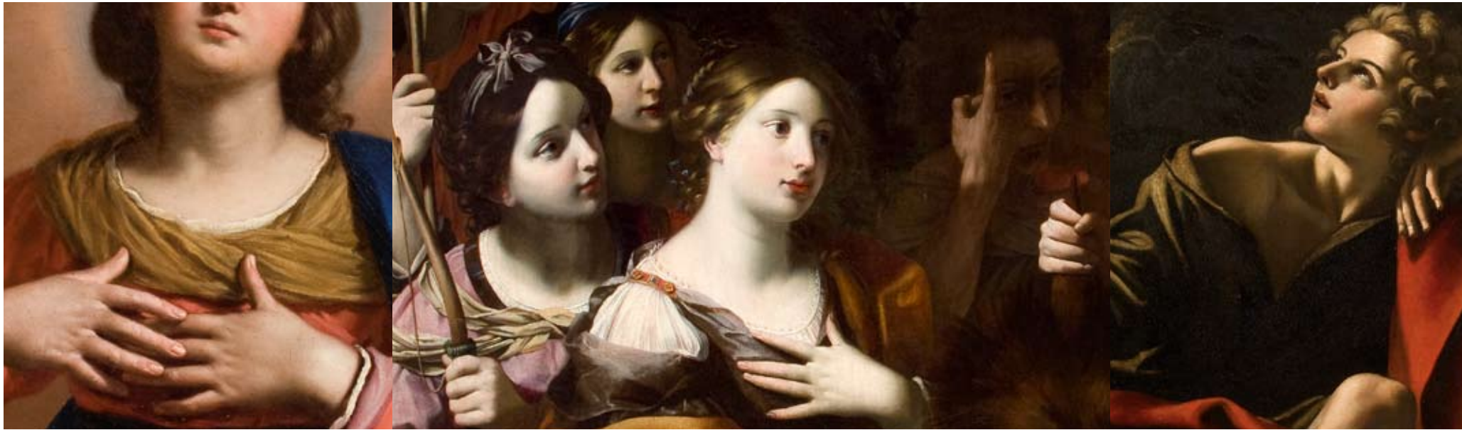
Giovan Francesco Barbieri detto "Guercino", Vergine Assunta , olio su tela; al centro: Michele Desubleo, Diana e Atteone , olio su tela; a destra: Sisto Badalocchio, San Giovanni Evangelista , olio su tela.