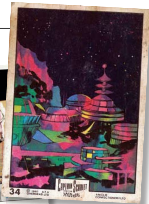
Due figurine raffiguranti una base spaziale e lo sbarco degli astronauti sulla luna esposte nella mostra Nostalgia di futuro , aperta dal 19 settembre al museo della figurina. Nell'immagine grande Katharina Grosse, Pigmentos Para Plantas y Globos , in mostra sempre dal 19 settembre alla Palazzina dei giardini.