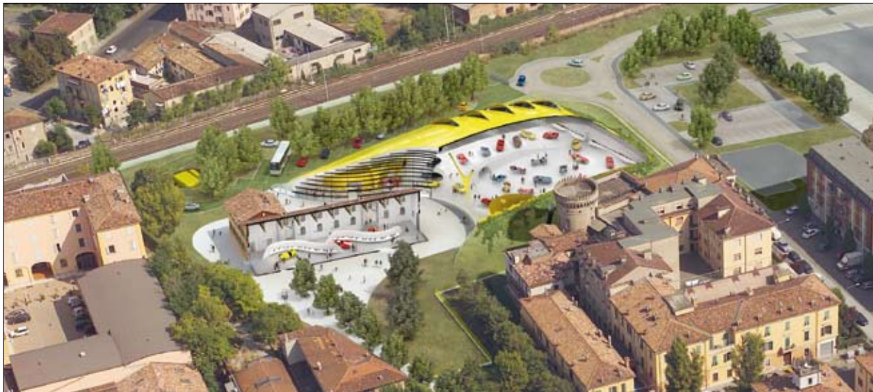
Simulazione al computer della parte esterna della casa natale di Enzo Ferrari. Sotto: l'immagine dell'interno.

Il degrado della pietra appare alquanto vario e differenziato in base alla tipologia di materiale e alla sua esposizione. Si prevede, quindi, di agire solo dove necessario per problematiche di conservazione delle pietre o per rischi di caduta di frammenti, senza cancellare completamente gli interventi del passato. Per tener conto delle esigenze ambientali, nelle lavorazioni verranno impiegati prevalentemente prodotti all'acqua e, qualora non fosse possibile, si dovranno utilizzare sostanze con minima tossicità.