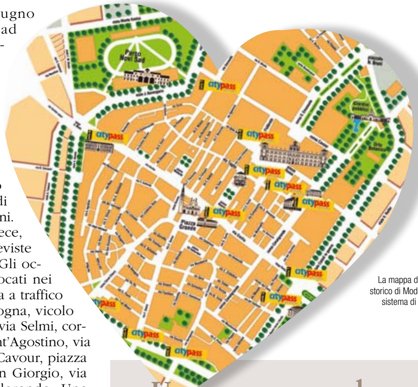
La mappa degli accessi al centro storico di Modena secondo il nuovo sistema di controllo automatico.