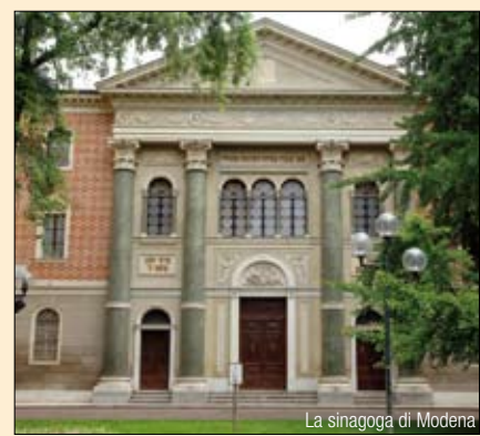
La sinagoga di Modena

Musica e Parole" sarà il titolo della Giornata europea della cultura ebraica in programma domenica 7 settembre. Aprire le porte, facilitare l'accesso e le visite ai luoghi della storia, delle tradizioni e della cultura ebraica sono gli obiettivi dell'iniziativa che si svolge in tutta Europa. A Modena il cuore della manifestazione sarà piazza Mazzini dove alle 9 verrà inaugurato l'archivio della comunità ebraica. Per tutta la giornata si potranno prenotare le visite guidate per le strade del ghetto e alle sinagoghe. Alle 11.30, sempre in piazza Mazzini, è prevista la presentazione del libro di Fulvio Diego Papoucha-