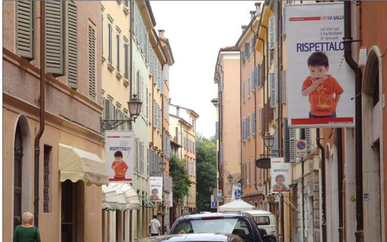
Via Gallucci con gli stendardi della campagna di sensibilizzazione contro i rumori notturni

Steward di strada, sensibilizzazione contro l'abuso di alcool, nuovi contenitori per la raccolta differenziata. Le azioni intraprese dal Comune di Modena in una delle zone più frequentate del centro storico