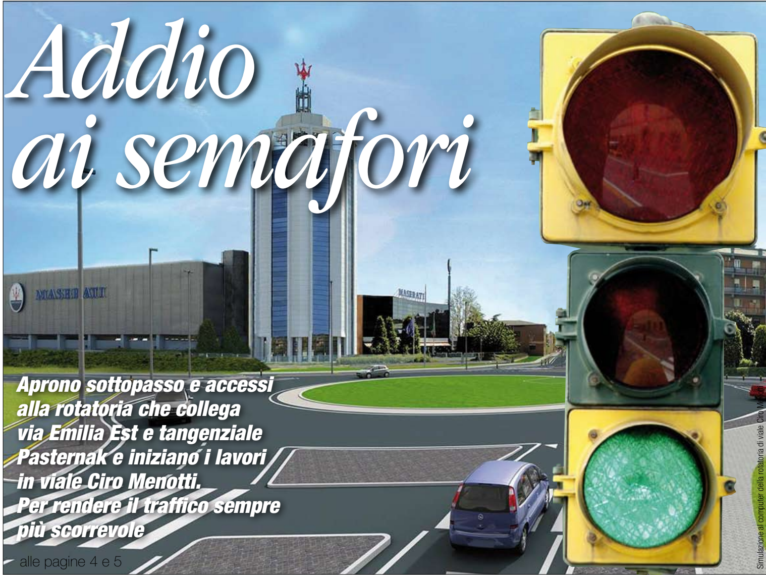
Simulazione al computer della rotatoria di viale Ciro Menotti