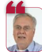
Paolo Ballestrazzi MODENA A COLORI

"Varie città dell'Emilia hanno subito attacchi criminosi, ma il tessuto è ancora in grado di reagire. La criminalità è come una piovra che lentamente prende le società, le ditte, i personaggi del mondo economico lasciandoli, poi, nella disperazione e con grossi problemi giudiziari. Il beneficio che può derivare dal semplice rafforzamento delle forze dell'ordine è assimilabile all'aspirina. A lungo andare quello che conta è il lavoro di intelligence e la certezza della pena".