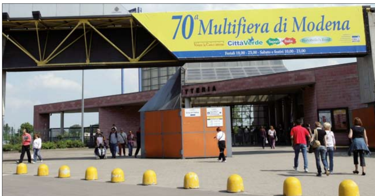
L'ingresso della 70esima Multifiera di Modena

Il Comune di Modena rinnova per altri 10 anni la concessione per l'uso del quartiere fieristico a Modena Esposizioni, ridefinisce l'assetto societario, e dà l'ok al nuovo Protocollo d'intesa tra Fiere di Bologna, socio di maggioranza, e gli azionisti modenesi, che definisce il piano di sviluppo dell'attività della società e l'impegno dei soci. È stata, infatti, approvata in Consiglio comunale la delibera, con il voto favorevole della maggioranza e del gruppo indipendente, contrario di Fi - Pdl e Modena a colori e con l'astensione di An - Pdl. Boccia, invece, la pregiudiziale presentata dal Fi - Pdl che chiedeva il rinvio della discussione. Modena Esposizioni prenderà il nome ModenaFiere e vedrà una crescita del capitale pari a 1 milione 500 mila euro, di cui 765 mila a carico di Fiere di Bologna, come quota parte, pari al 51%, e i rimanenti 735 mila a carico dei soci modenesi. Si andrà, inoltre, al superamento dell'attuale composizione societaria ai piedi della Ghirlandina: "L'obiettivo - spiega l'assessore all'Innovazione e promozione del sistema locale Roberto Guerzoni - è quello di accorciare la catena delle partecipazioni facendo sì che i tre enti che compongono la compagine di Promo, (Camera di Commercio, Provincia e Comune), siano direttamente i soci di Modena Esposizioni". Promo, che finora aveva il 44%, arriva