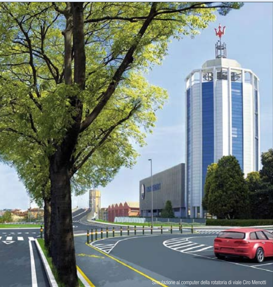
Simulazione al computer della rotatoria di viale Menotti