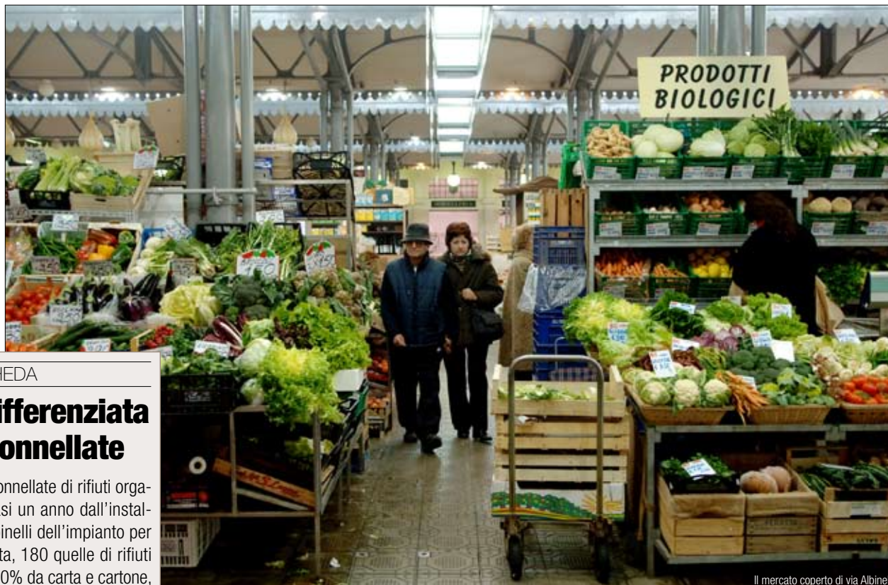
Il mercato coperto di via Albinelli