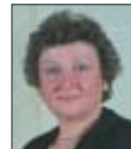
Adriana Querzè Assessore all'Istruzione

"Nei servizi educativi e scolastici per la fascia d'età 0-6 anni, la scuola modenese – ha osservato Querzè – è a tutti gli effetti una scuola europea". I parametri fissati dal Consiglio europeo per il 2010 – 33 per cento di copertura nei nidi e 90 per cento nelle scuole d'infanzia – sono, infatti, già oggi raggiunti con un 38 per cento di bambini accolti nei nidi (la media nazionale è del 7,4 per cento) e il 100 per cento dei bambini accolti nelle scuole