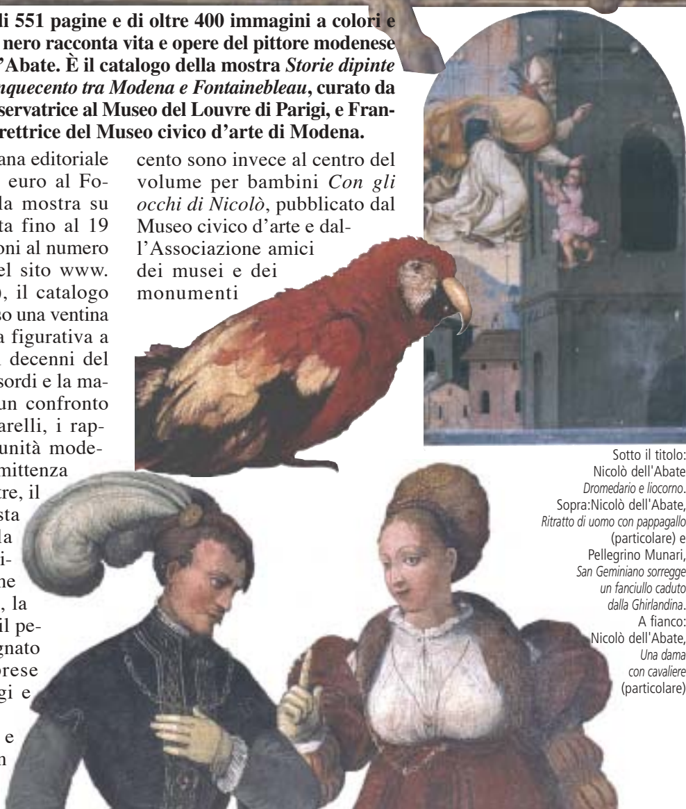
Sotto il titolo: Nicolò dell'Abate Dromedario e liocorno . Sopra: Nicolò dell'Abate, Ritratto di uomo con pappagallo (particolare) e Pellegrino Munari, San Geminiano sorregge un fanciullo caduto dalla Ghirlandina . A fianco: Nicolò dell'Abate, Una dama con cavaliere (particolare)

cento sono invece al centro del volume per bambini Con gli occhi di Nicolò , pubblicato dal Museo civico d'arte e dall'Associazione amici dei musei e dei monumenti