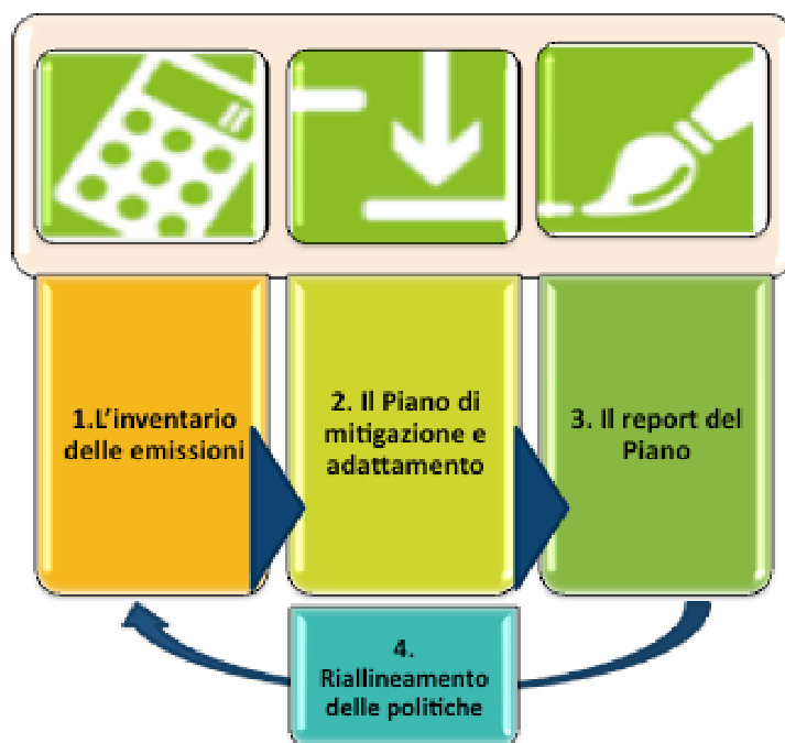
Figura 1. Il processo per le politiche per il clima

Questo documento va inserito all'interno di questo processo, e proprio da esso trae la sua efficacia. Ognuno degli interventi contenuti nel piano per il breve periodo (2010-2013) è supportato da una scheda che ne definisce i responsabili, i tempi di attuazione, i risultati attesi e le risorse finanziarie necessarie. Il monitoraggio, la verifica e la valutazione del processo di riduzione delle emissioni di CO 2 assicurano la possibilità di continuare a migliorare nel tempo il Piano e ad adattarsi alle condizioni in mutamento, per conseguire comunque il risultato di riduzione atteso.