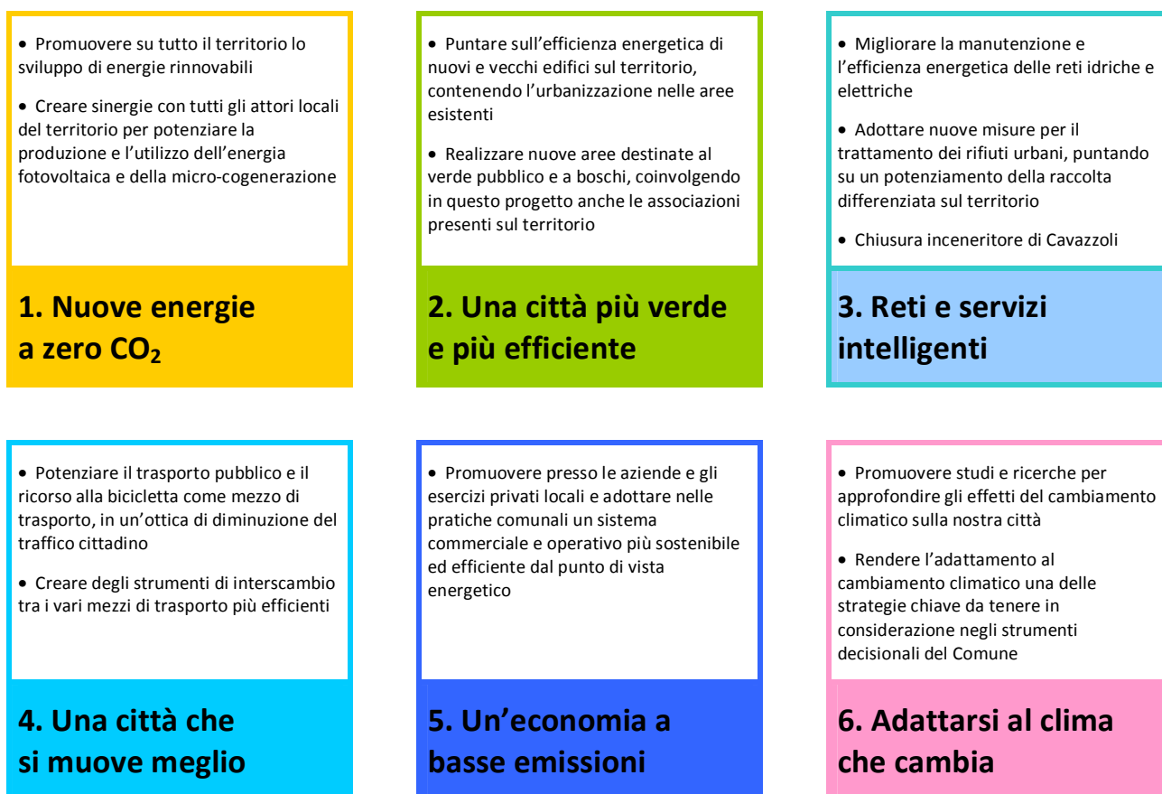
Figura 5. Le linee di intervento per area

Il Comune si impegna a raggiungere il target prefissato realizzando un certo numero di iniziative specifiche in ognuna delle aree individuate secondo le linee di intervento principali mostrate nella Figura 5.