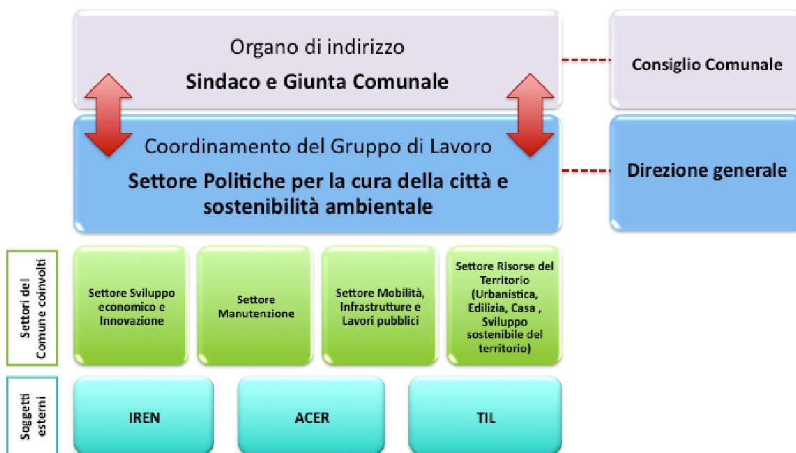
Figura 2. Organigramma della struttura organizzativa del Comune per la definizione e attuazione del Piano

Il Piano è infatti un complesso insieme di azioni e misure tecniche decise dall'Amministrazione Comunale e da altri soggetti pubblici e privati, da attuarsi nel territorio della città.