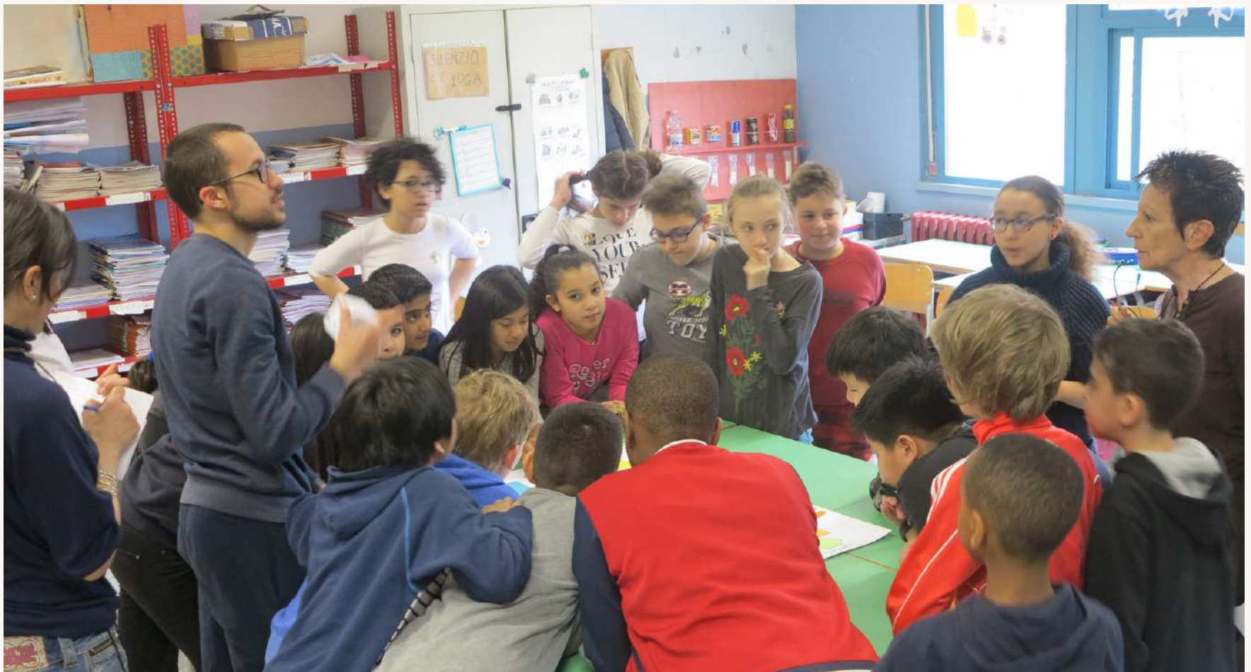
La classe al lavoro